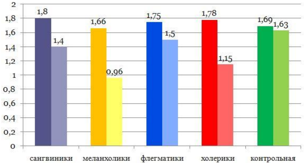
Рис. 2 – Динамика индекса ОНI-S у детей младшего школьного возраста, спустя 1 год после обучения

Следует отметить, что в результате обучения детей гигиене полости рта с учетом типа темперамента по сравнению с контрольной группой динамика достоверного улучшения индивидуального ухода за полостью рта заметна во всех выделенных группах, но особенно – в группах меланхоликов и холериков (больше, чем на 0,5 балла по индексу Грина-Вермильона) (Рис. 3 ).