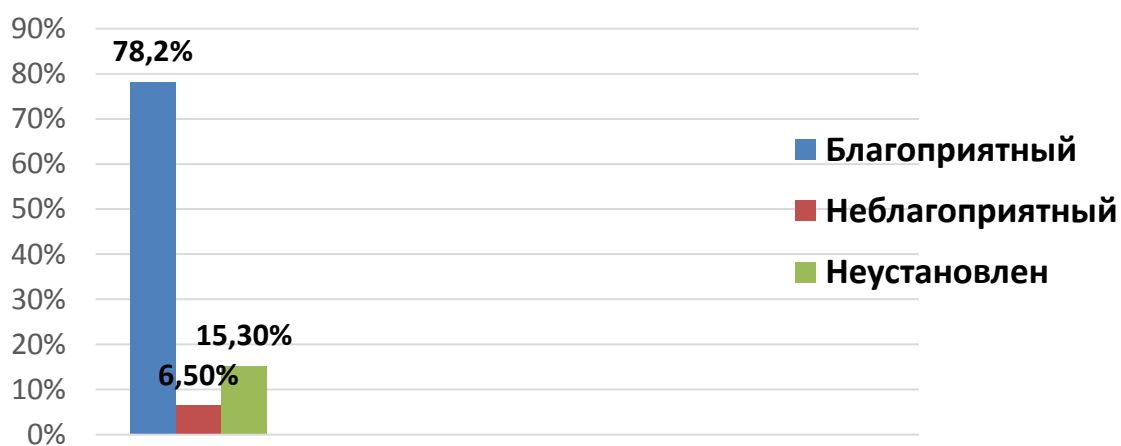
Рисунок 1 – гистологический тип по Шимадо

(15,2%), III – 19 (41,3%), IVS – 5 (10,9%). Локализация: надпочечники – 16 пациентов (34,8%), абдоминальные – 12 (26,1%), торакальные – 14 (30,4%), шея – 2 (4,3%), тазовая область – 1 (2,2%), паравертебральный симпатический узел – 1 (2,2%). Встречались следующие гистологические типы: ганглионейробластома – 10 (21,7%), дифференцированная – 1 (2,2%), дифференцирующаяся – 11 (24%), низкодифференцированная – 18 (39,1%), недифференцированная – 4 (8,7%), неустановленная – 2 (4,3%). МКИ индекс: высокий (>5%) – 1 (2,2%), средний (2-4%) – 3 (6,5%), низкий (<2%) – 22 (47,8%), не установлен – 20 (43,5%). Благоприятный гистологический тип по Шимада (рис. 1) наблюдался у 36 пациентов (78,2%), неблагоприятный у 3 (6,5%), не установлен у 7 (15,3%).