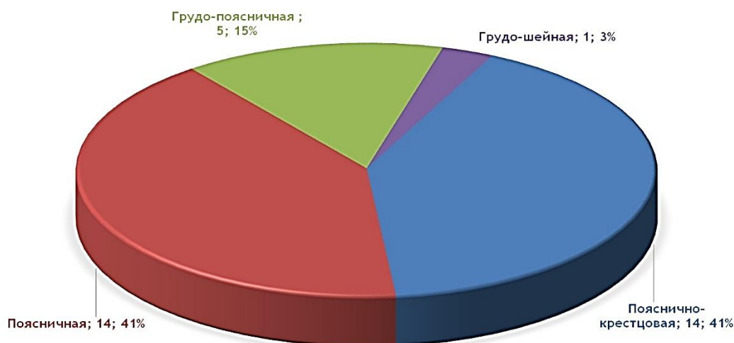
Рисунок 1 – Частота локализации Spina bifida aperta

Наиболее часто встречающаяся локализация порока – в пояснично-крестцовой области (Рисунок 1).