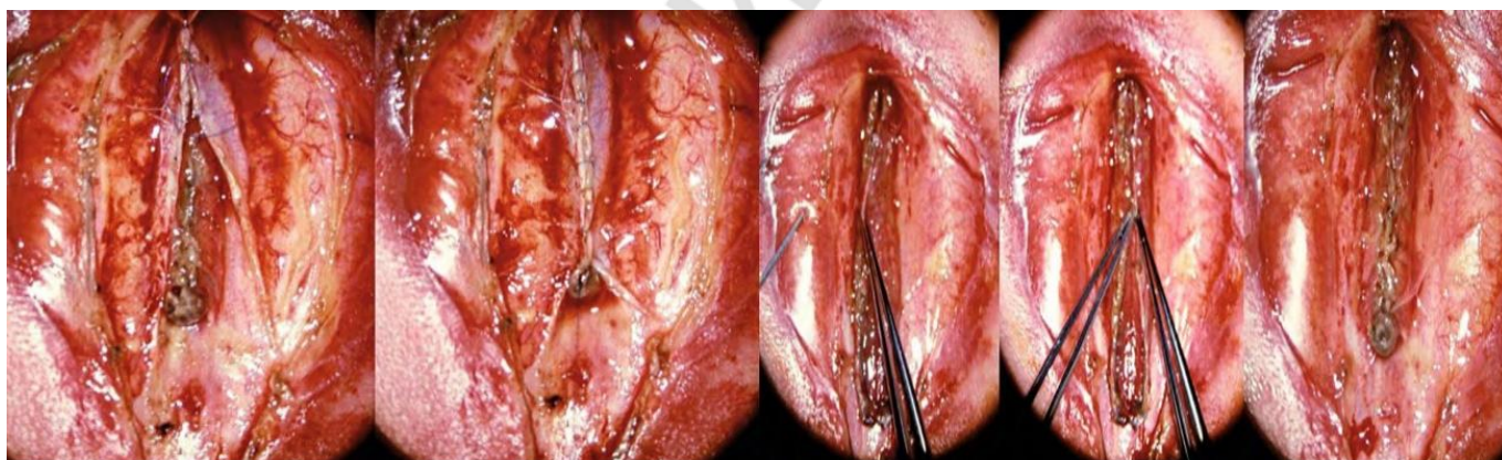
Рисунок 4 - Декомпрессия задней черепной ямки – 2 (4,5%) пациентам

Положительная динамика после лечения отмечена у 43 (98%) пациентов. Летальный исход – у одного пациента в периоде новорожденности (Рисунок 5). Причинами летального исхода являлись грубая сопутствующая патология и послеоперационная пневмония.