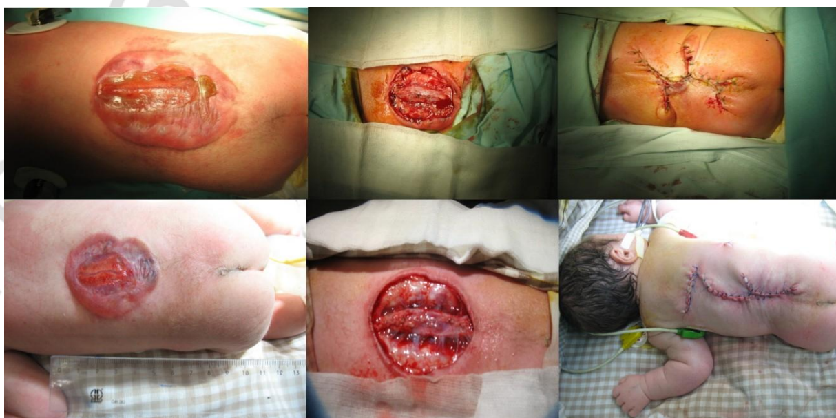
Рисунок 5 – Результаты оперативного лечения