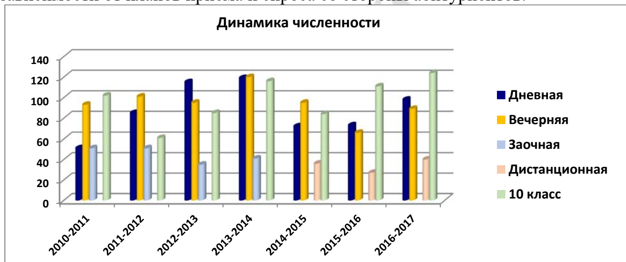
Рисунок 1 – Динамика численности слушателей подготовительного отделения по видам обучения.

Динамика численности слушателей разных форм обучения отражена на рисунке 1. За анализируемый период контингент обучающихся варьировал в зависимости от планов приема и спроса со стороны абитуриентов.