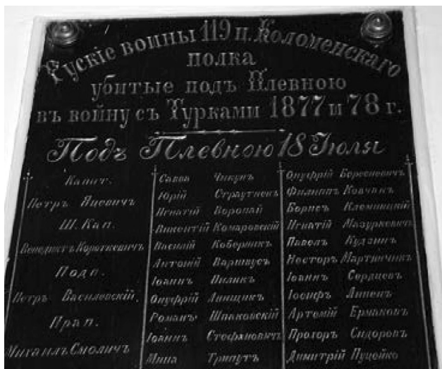
Фото 2. Памятная доска с именами воинов 119 пех. Коломенского полка, погибших под Плевной