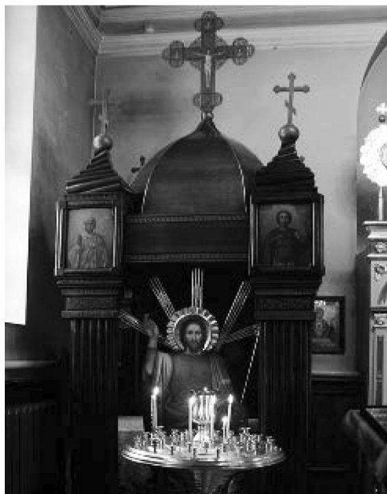
Фото 4. Походная церковь 119-го пехотного Коломенского полка