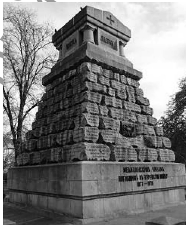
Фото 5. «Докторский памятник» 531 русскому медику, погибшему во время Русско-турецкой войны 1877—1878 гг.

И в заключение, в честь памяти славного подвига русского воинства, а с ним неразлучно следующего рука-об руку медицинского сословия хочется привести строки из воззвания к своим соотечественникам болгарского общественного деятеля, учителя и адвоката Ивана Георгия Чунчева из города Пазарджика: «...Нет в истории примера этому славному и прекрасному делу... Чтобы поднялись люди в суровой Сибири, далекой Казани, в холодном Архангельске, Астрахани, в славной Москве и великом Санкт-Петербурге и,