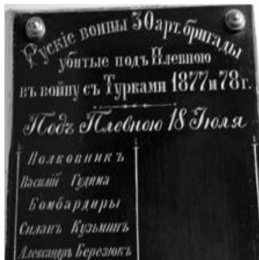
Фото 3. Памятная доска с именами воинов 30-й артбр, погибших под Плевной