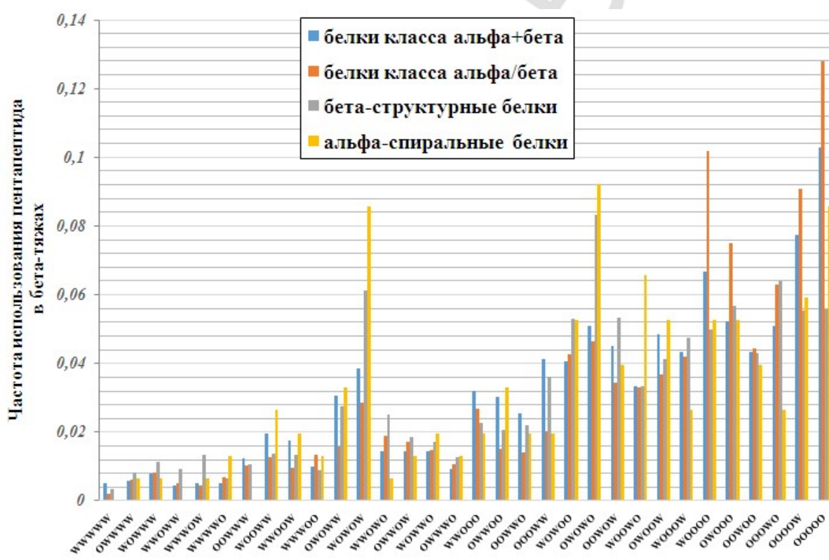
Рис. 2 Частоты использования пентапептидов, состоящих из гидрофильных (W) и гидрофобных (O) аминокислотных остатков в бета-тяжах четырёх структурных классов белков

Упомянутый выше аргинин достоверно чаще входит в состав бета-тяжей из бета-структурных белков и белков класса альфа+бета, по сравнению с альфа-спиральными белками и белками класса альфа/бета. То есть, аргинин чаще включается в состав бета-тяжей или полностью бета-структурных белков, или белков, в которых есть бета-структурные домены. Тренд для серина и изолейцина также воспроизводится при сравнении белков класса альфа+бета и альфа/бета: серин предпочитает бета-структуры из бета-структурных доменов, а изолейцин – отдельные бета-тяжи.