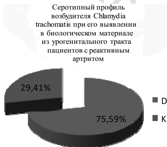
Рисунок 3. Уровни нормализованной экспрессии гена Ct604 Chlamydia trachomatis в образцах из урогенитального тракта пациентов с реактивным артритом

Критерий \chi^2 с поправкой Йейтса составил 21,688 при p < 0,01 , что свидетельствует о статистически достоверной значимости различий исходов в зави-