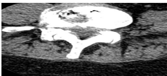
Рисунок 3 – Эффект вакуума («вакуум-феномен») в МПД поясничного отдела на КТ-изображении

изменения прилежащих к диску отделов позвонков – они становятся уплотненными, склерозированными, с наличием субхондаральных кист и узлов Шморля [2].