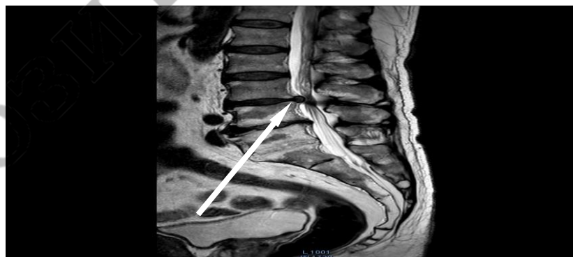
Рисунок 2 – Грыжа МПД поясничного отдела на МР-изображении (указана стрелкой)

На МР-томограммах грыжа имеет четкий ровный контур. Форма грыжи в сагиттальной плоскости может быть грибовидной, языковидной, грыжа может спускаться вниз по переднему эпидуральному пространству. Обычно грыжа дает сигнал такой же интенсивности, как и диск [5].