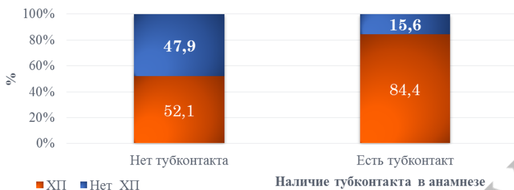
Рисунок 1 – Назначение химиопрофилактики в 2 группах детей ( \chi^2=11,29 , p<0,05 )

Средний возраст в группе с ХП «+» составил 8 (4-13) лет, в группе ХП «-» 6,5 (3-11) лет, разность статистически значимых различий не выявлено ( p>0,05 ).