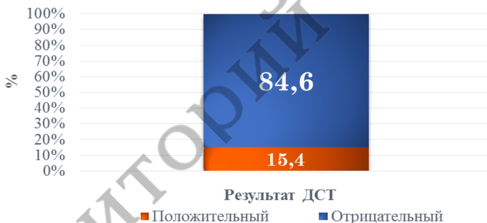
Рисунок 4 – Распределение пациентов по результатам ДСТ по окончании диспансеризации

Из 26 детей, которым проводили по окончании диспансеризации ДСТ, результат положителен у 15,4% (4 человека: из них 3 получали ХП, 1 ребенок не получал).