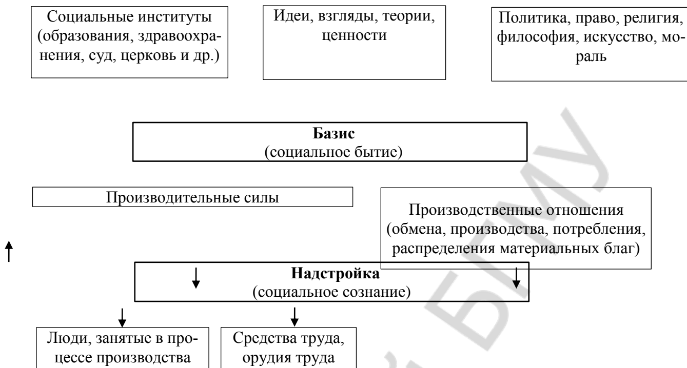
Рис. 3. Модель общества в марксизме

Общество развивается по определенным закономерностям (прежде всего, экономическим), а способ производства материальных благ определяет в итоге уровень развития общества. Вся история в марксизме — закономерный естественно-исторический процесс последовательной смены одних общественно-исторических формаций другими на основе изменения способов производства. Общественно-экономическая формация — это общество на определенном этапе исторического развития со свойственными ему базисом и надстройкой. Маркс и Энгельс выделяют пять общественно-экономических формаций: первобытнообщинную, рабовладельческую, феодальную, капиталистическую и коммунистическую .