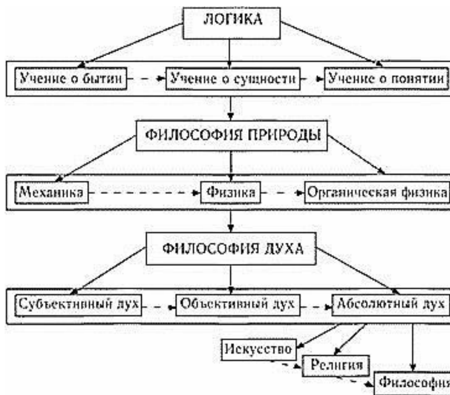
Рис. 2. Основные части философской системы Гегеля

Логика Гегеля составляет базовую часть его системы, поскольку тождество мышления и бытия означает, что законы мышления, которыми и занимается логика, суть подлинные законы бытия: и природы, и человеческой истории, и познания.