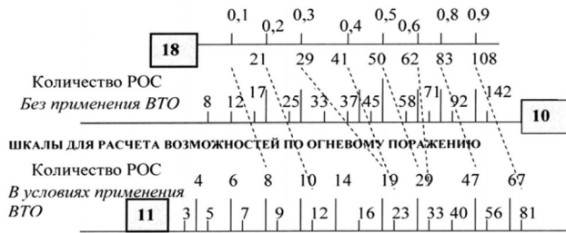
Рис. 2. Шкалы для расчета возможностей по огневому поражению

с надписью «мероприятия защиты не проводятся», римские цифры I, II, III, а также надпись «прогнозируемая потеря боеспособности», под движком 21 нанесена надпись расшифровки значений римских цифр I, II, III и метка с надписью «с учетом лесистости».