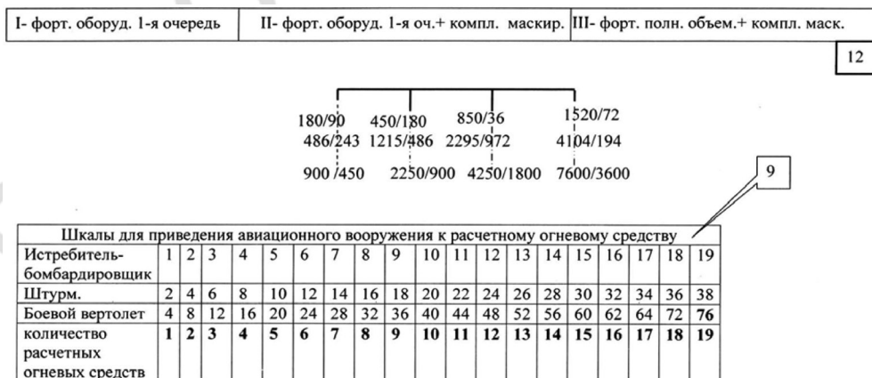
Рис. 4. Цифровые значения РОС в приведенных единицах, шкалы перевода в расчетные боеприпасы, шкалы для приведения авиационного вооружения к РОС