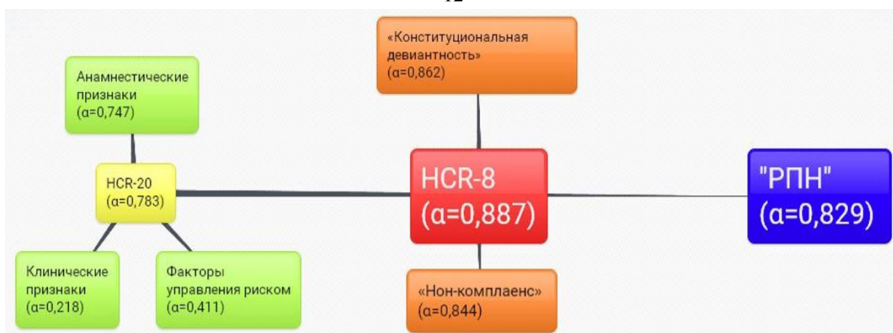
Рисунок 1. – Схема разработки шкалы «Риск повторного насилия» (РПН) с помощью факторного анализа и логистической регрессии на выборке мужчин, страдающих параноидной шизофренией

Как видно из рисунка 1, методика оценки риска насилия HCR-20 путём факторного анализа была преобразована в двухфакторный конструкт HCR-8. Далее с помощью логистической регрессии к HCR-8 были добавлены три предиктора повторных насильственных ООД (выявлены отдельно), что позволило сконструировать методику РПН («Риск Повторного Насилия»). Полученные результаты говорят об улучшении параметров внутренней надежности HCR-8 и РПН (в сравнении с HCR-20).