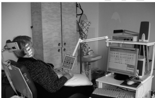
Рис. 1. Запись ЭМГ

Измерения проводились в тихих и комфортных для пациента условиях. Каждая запись начиналась со смыкания челюстей в положении максимального контакта искусственных зубов. Пациентов просили найти это исходное положение путем легкого постукивания протезами и затем плотно сжать челюсти. Запись суммарной электромиограммы осуществляли с помощью компьютерной нейрофизиологической диагностической системы «Нейро-МВП-4» фирмы «НейроСофт» (Россия) (рис. 2).