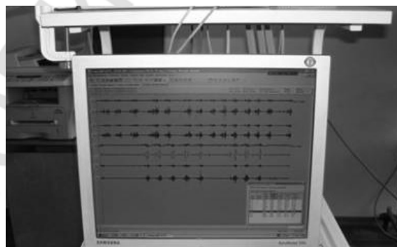
Рис. 2. Регистрация ЭМГ

Оценивали наличие спонтанной биоэлектрической активности при максимальном произвольном напряжении, а также при жевании 0,8г ореха миндаля. Определяли для каждой записи максимальную амплитуду (размах) в мВ и суммарную амплитуду за 1 с в мВ/с.