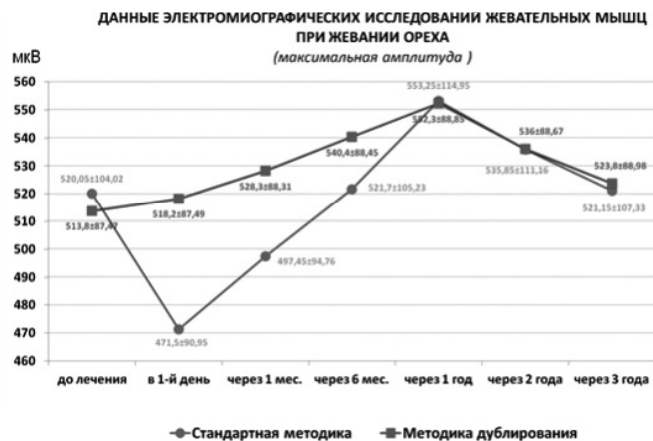
Рис. 3. Максимальная амплитуда при жевании ореха