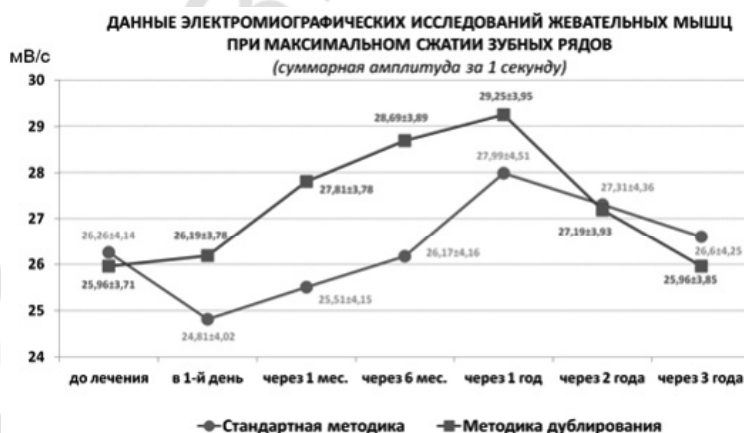
Рис. 4. Суммарная амплитуда при сжатии зубных рядов

Анализируя данные исследований работы (суммарная амплитуда за 1 с) жевательных мышц при максимальном сжатии искусственных зубных рядов у первой группы составляла 26,26 \pm 4,14 мв/с до лечения, во второй 25,96 \pm 3,71 мв/с (рис. 4).