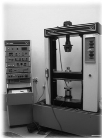
Рис. 3. Универсальная тестирующая машина «Инстрон»

Исследование № 5: Определение силы адгезии методом микроиспытаний на сдвиг. Для проведения испытаний были использованы удаленные зубы. Из коронковой их части, при помощи алмазного сепарационного диска делали продольные спилы толщиной 1-2 мм. Полученные спилы зубов фиксировали в образцах из пластмассы холодной полимеризации «Протакрил-М». Для определения силы адгезии была использована универсальная тестирующая машина «Инстрон».