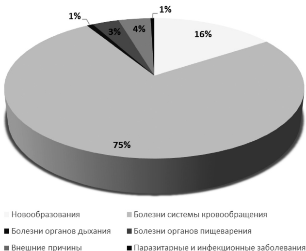
Диаграмма 3. Структура женской смертности в РБ за 2015 год поможет увеличить продолжительность и улучшить качество жизни женского населения.

В настоящее время основной гипотезой в патогенезе наступления климакса является теория генетически запрограммированной инволюции яичников, которая сопровождается недостаточной продукцией ингибина, что приводит к повышению уровней ФСГ и ЛГ и, как следствие, появлению ановуляторных циклов с последующей атрезией фолликулов. Прекращение овуляции нарушает циклическую секрецию эстрадиола и прогестерона, наступает склероз ткани яичников. После наступления менопаузы основным источников эстрогенов (эстрона) в женском организме становятся периферические ткани (жировая, мышечная и другие). При этом соотношение андрогенов и эстрогенов резко меняется в сторону первых. Общим у всех женщин в климаксе является снижение количества прогестерона [2].