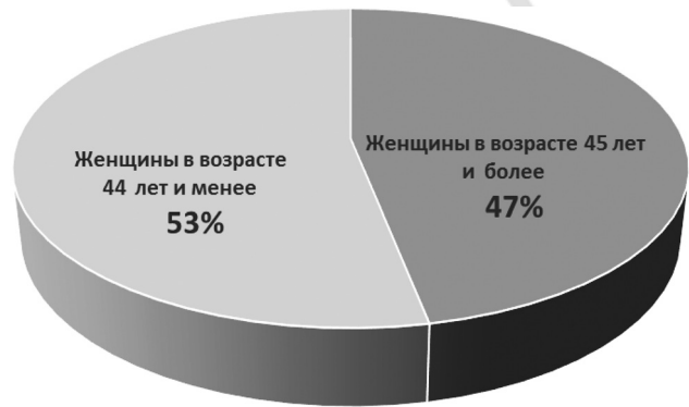
Диаграмма 1. Процентное соотношение женщин в возрасте от 45 лет и более по отношению к остальным возрастным группам в РБ за 2016 год

Рецепторы к женским половым гормонам найдены практически во всех тканях человеческого организма, что доказывает важность половых стероидов для поддержание его нормальной жизнедеятельности. В то же