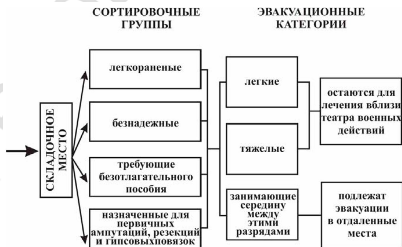
Рис. 2. Схема сортировки (по Н. И. Пирогову)

Таким образом, к началу XX века, несмотря на большое внимание, уделявшееся видными деятеля-