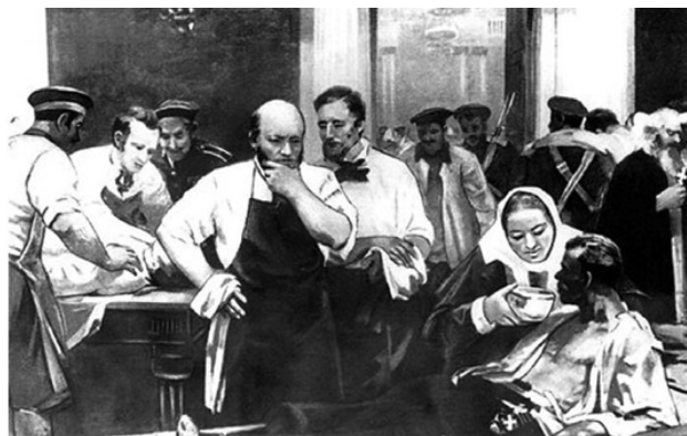
Рис. 1. Н. И. Пирогов на главном перевязочном пункте в Севастополе

Таким образом, в основу медицинской сортировки во время Крымских кампаний заложен предложенный Н. И. Пироговым принцип нуждаемости в том или ином виде медицинской помощи. Вместе с тем, сам Пирогов не отрицал необходимость сортировки и в эвакуационных целях. При этом он