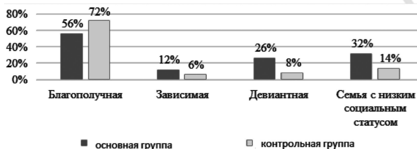
Рис. 2. Социальная характеристика семей исследуемых лиц