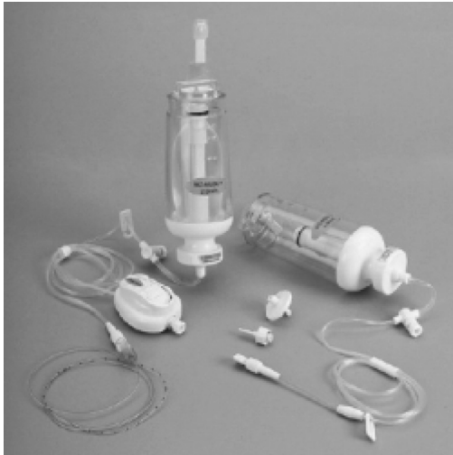
Рис. 1. Микроинфузионные стерильные одноразовые помпы с набором аксессуаров для регулирования скорости подачи раствора