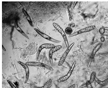
Рис. 1. Вид D. folliculorum и D. brevis под микроскопом

– реакция на продукт деацетилирования хитина – хитозан (рис. 3), который получали при проведении микробиологических методов: деацетилирование молекулы хитина с помощью ферментов-деацетилаз, продуцируемых бактериями (использована мазь для наружного применения Биосептин, содержащая бактерии Bacillus amyloliquefaciens штамм ВКПМ В-10642 (DSM 24614) и Bacillus amyloliquefaciens штамм ВКПМ В-10643 (DSM 24615)). Для установления наличия хитозана в растворе применялась реакция с йодом. На положительный результат указывало появление фиолетового окрашивания.