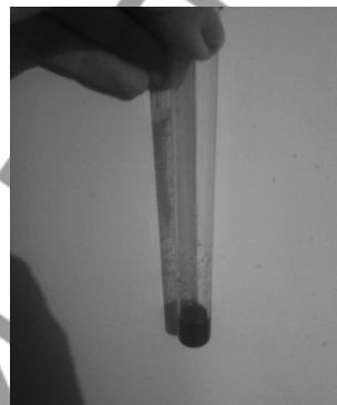
Рис. 2. Смыв с кожи пациентки после проведения реакции с дифенилкарбазолом