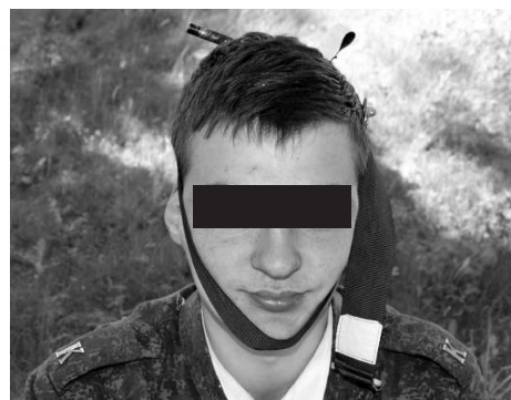
Рис. 3. Транспортная иммобилизация нижней челюсти с использованием турникета ТКБ-1

Следует отметить, что хотя в обеих группах разведение локтевых суставов после иммобилизации было невозможным, использование турникета ТКБ-1 обеспечивало возможность дотягивания ленты при необходимости дополнительного сведения локтевых суставов вследствие постепенного расслабления мышц плечевого пояса. Таким образом, применение турникета ТКБ-1 позволяет быстро зафиксировать локтевые суставы за спиной условно раненого и обеспечивает