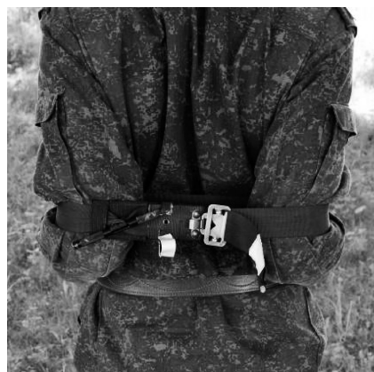
Рис. 4. Транспортная иммобилизация ключицы с использованием турникета ТКБ-1

Необходимо отметить, что фиксация шины из подручного материала к плечу в порядке самопомощи с использованием бинта из ППИ потребовала 193,52 (178,56; 210,45) с, что в 1,77 раза дольше, чем при использовании турникета ТКБ-1 (109,27 (97,03; 119,54) с, ( p = 0,000000 )). При этом при использовании для фиксации бинта 13 испытуемых вообще не смогли зафиксировать шину.