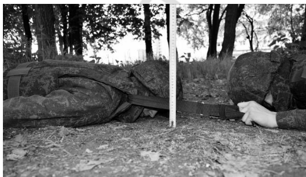
Рис. 7. Эвакуация условно раненого перетаскиванием с использованием турникета ТКБ-1

Эвакуацию условно раненого из моделированной опасной зоны (из-под огня противника) на 10 м с использованием турникета ТКБ-1 (рисунок 7) эвакуирующие выполняли за 61,74 (59,83; 64,08) с, что сопоставимо по скорости с эвакуацией методом переползания на боку (62,07 (60,12; 64,82) с, p = 0,562571 ). Однако при использовании для перетаскивания турникета ТКБ-1 высота возвышения раненого и эвакуирующего над поверхностью земли в среднем составила 24,0 (24; 25) см, а при переползании на боку – 34,0 (33; 35,5) см ( p = 0,000000 ),