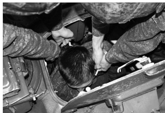
Рис. 8. Извлечение условно раненого с места наводчика оператора БМП-2 с использованием двух турникетов ТКБ-1

Такое существенное сокращение времени на извлечение раненого из бронетехники снижает риск ранения бойцов, поднявшихся «на броню», так как БМП-2 в ходе боя находится в опасной зоне (под огнем противника) и значительно возвышается над уровнем земли.