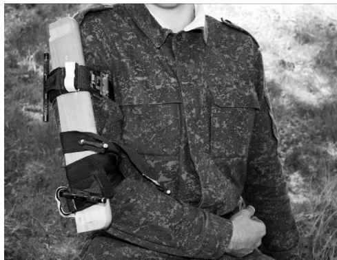
Рис. 5. Фиксация шины из подручного материала к плечу с использованием двух турникетов ТКБ-1

Фиксацию двух шин из подручного материала к голени в порядке взаимопомощи с использованием двух турникетов ТКБ-1 (рисунок 6) испытуемые выполнили достоверно на 30,52 с быстрее, чем фиксацию таких же шин с использованием бинта из ППИ (за 44,99 (44,00; 47,59) с при использовании ТКБ-1 и за 75,51 (71,93; 78,86) с при использовании бинта, p = 0,000 ). Как и при фиксации шины к плечу, при транспортной иммобилизации голени каждым из способов шины были зафиксированы неподвижно.