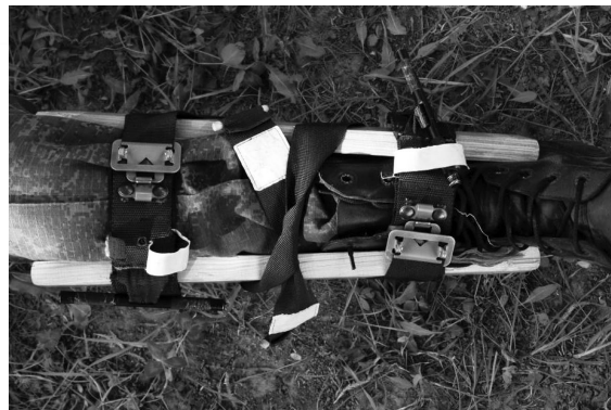
Рис. 6. Фиксация двух шин из подручного материала к голени с использованием двух турникетов ТКБ-1

что делает условно раненого и эвакуирующего более заметными для противника.