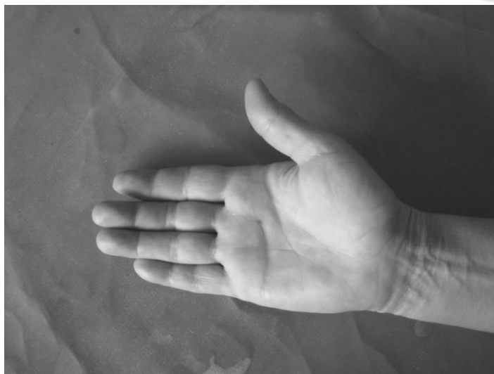
Рис. 2 - Кисть пациентки по окончании операции

сти у пациентов не было, напротив сроки её восстановления сократились почти втрое. Применение новой методики в хирургической практике безусловно важно и необходимо, т.к. она, при наличии соответствующего опыта у хирурга, позволяет избежать рецидивов заболевания и сократить сроки восстановления трудоспособности.