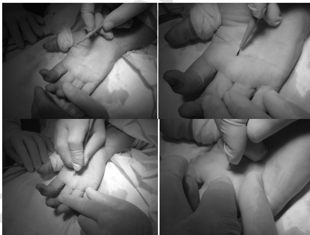
Рис. 1 - Этапы операции закрытой лигаментотомии

Для рассечения связок использовали офтальмологический скальпель, острие которого вводили через точечные кожные проколы над фиброзной рубцово утолщенной связкой и продольно, над сухожилием рассекали её, мануально контролируя исчезающее сопротивление, вызвавшей стеноз, кольцевидной связки (рис.1).