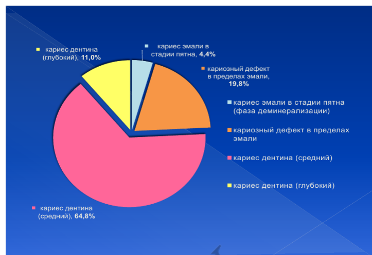
Рисунок 3 – Процент клинических форм кариеса