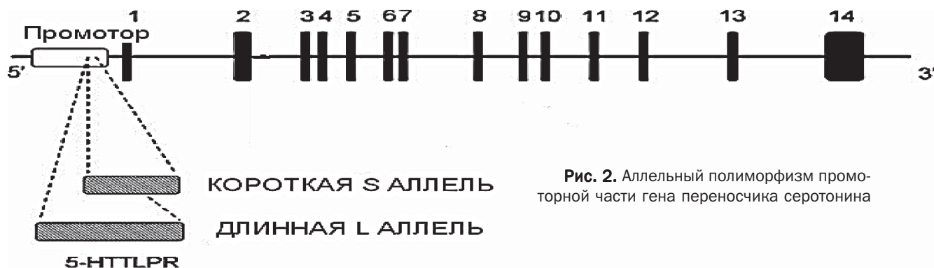
Рис. 2. Аллельный полиморфизм промоторной части гена переносчика серотонина

в замороженном состоянии при -18°C. Полимеразная цепная реакция проводилась на амплификаторе MyCycler™ Thermal cycler (BIORAD). Использовали следующие праймеры: [F]-5'-GGCGTTGCCGCTCTGAATTGC-3', [R]-5'-GAGGGACTGAGCTGGACAACCCAC-3'.