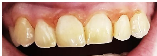
Рисунок 9 – Пациент В., через 6 месяцев после мотивации

Рисунок 8 – Пациент В., через 3 месяца после мотивации