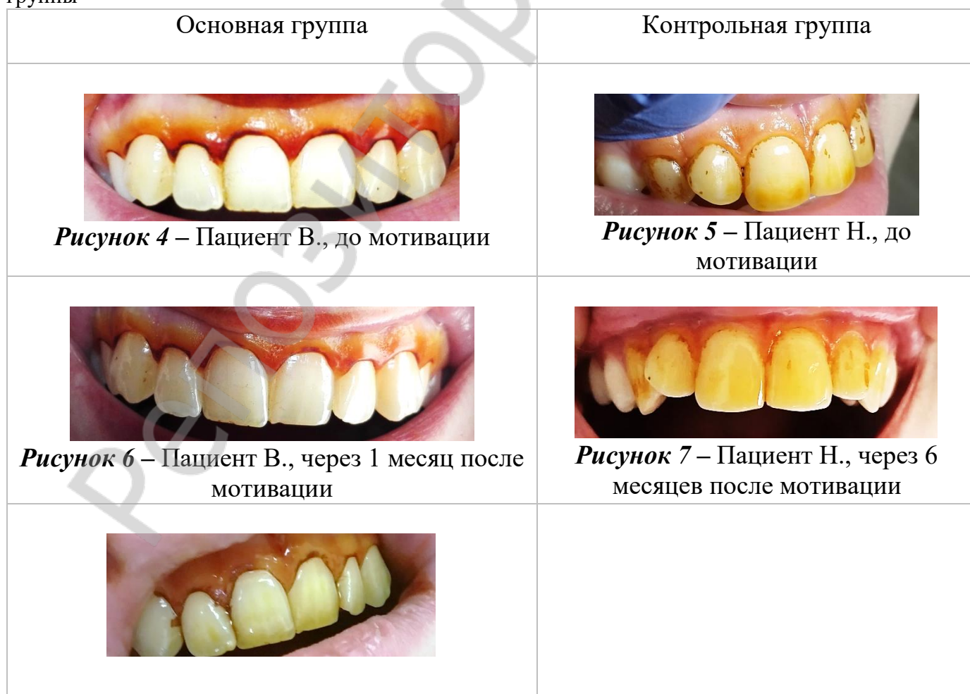
Таблица 1. Результаты проведения пробы Шиллера-Писарева у пациентов основной и контрольной группы

По результатам проведения пробы Шиллера-Писарева после мотивации интенсивность окрашивания десны и зубов у основной группы ниже (таблица 1, рисунок 4-9).