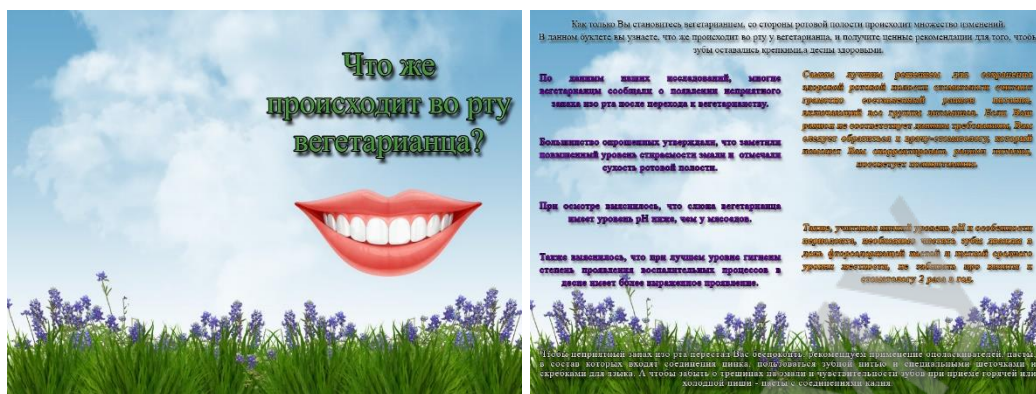
Рисунок 1 – Мотивационное пособие, использованное в ходе исследования