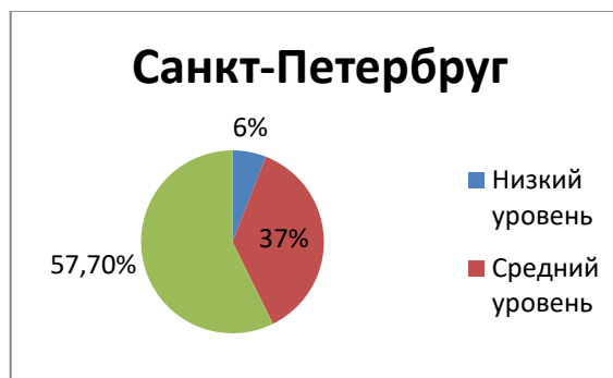
Рис. 2 –Уровень профессионального выгорания в выборке Санкт-Петербурга

местом своего постоянного проживания, а 80% - хотели бы сменить место жительства, ввиду негативного влияния климатических условий на рабочий процесс и психоэмоциональное состояние. Врачи, имеющие низкий уровень психологического истощения отметили, что погодные условия на них никак не влияют и сменить ПМЖ они не хотят. При этом заработной платой удовлетворены – 23% , хотели бы увеличения заработной платы – 77 %.