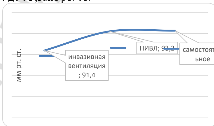
Рис.1 – Изменение средних величин pO_2

Результаты и их обсуждение. В исследовании была прослежена динамика данных по таким показателям как: pO_2 , pCO_2 и сатурации. По данным парциального давления кислорода в артериальной крови мы получили следующие результаты (рисунок 1), из которых видно, что с течением времени среднее значение показателя pO_2 возросло со значения 91,4 до 93,3 мм рт. ст.