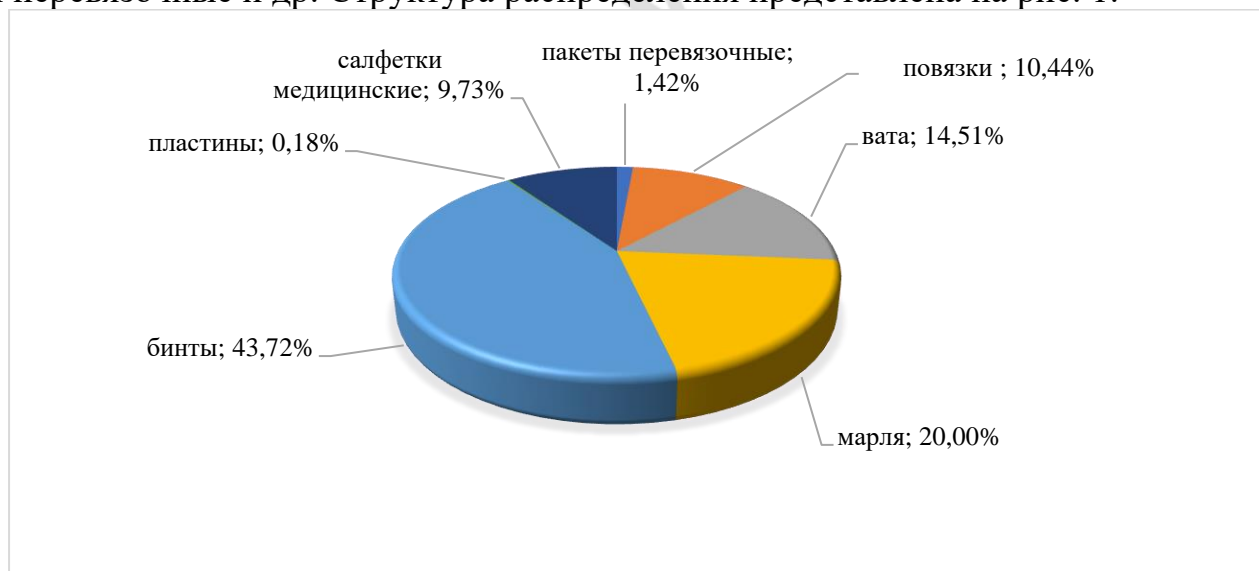
Рис. 1 – Структура украинского рынка перевязочных средств в зависимости от формы

Современный рынок перевязочных средств является неотъемлемой частью фармацевтического рынка и характеризуется значительным разнообразием ассортимента и стран-производителей. На сегодняшний день установлено, что основной ассортимент формируют такие группы перевязочных средств: вата, бинты, марля, пакеты перевязочные и др. Структура распределения представлена на рис. 1.