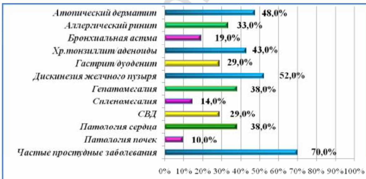
Рисунок 2 - Структура сопутствующей патологии у детей, страдающих врожденным ихтиозом