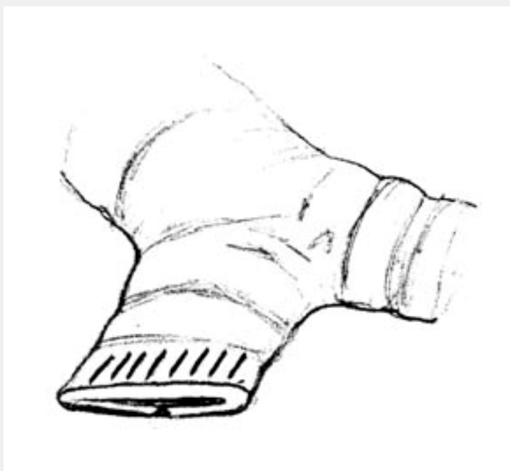
Рис. 1. Формирование культи бронха при помощи сшивающего аппарата

При благоприятной для аппаратного шва форме поперечного сечения бронха, обеспечивающей его прочность и происходило заживление большей части КБ, преимущественно по типу первичного. Этим, по-видимому, объясняется тот факт, что внедрение аппаратного шва позволило значительно снизить частоту БС по сравнению с ручным швом КБ по Суиту, при котором не происходит сплошного сдавления стенок бронха. В этом случае заживление КБ происходит по смешанному типу – непосредственно в зоне лигатур – по первичному, а в промежутках – по вторичному (Рис. 2).