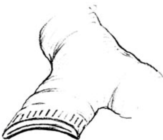
Рис. 2. Формирование культи бронха ручным швом по Суиту

Во-вторых, наши исследования [1] показали, что контакт КБ с плевральным экссудатом при недостаточном ушивании медиастинальной плевры или неполном укрытии ее какими-либо лоскутами приводит к угнетению репаративных процессов в культе бронха за счет более длительного периода отека, инфильтрации, замедленного формирования грануляционной, а затем, и соединительной ткани.