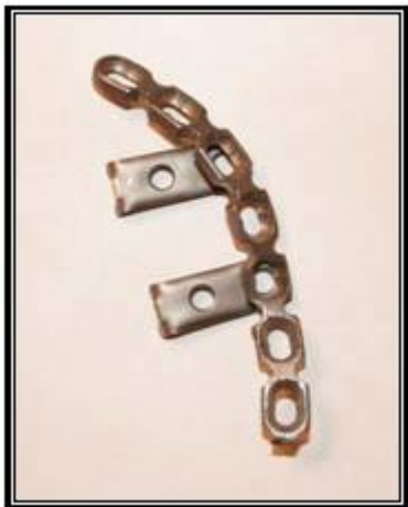
Рисунок 4.- Титановая реконструктивная пластина «Медбиотех» в комбинации с пластинами- «рессорами»

Данные о времени операций и интраоперационной кровопотери представлены в таблице 1. Максимальные величины этих показателей при выполнении одиночного заднего доступа отмечались в случаях больших сроков после травмы (более 3 недель) и при оскольчатых переломах. Применение комбинированных доступов в таких случаях было более оправдано, так как при схожей степени тяжести вмешательства, качество первичной репозиции отломков было значительно выше.