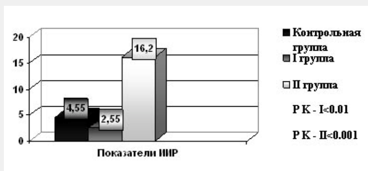
Рис. 1 Показатели ИИР у обследованных детей

У детей I группы ИИР составил в среднем 2,55 \pm 0,2 , у новорожденных II группы – 16,2 \pm 1,5 (Рис. 1).