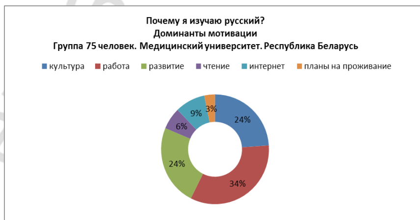
Таблица 6. Доминанты мотивации опроса «Почему я изучаю русский?». 75 студентов. Государственный медицинский университет. Республика Беларусь.

Абсолютное большинство участников (69,3%) заявили о необходимости русского языка для будущей работы , что почти дублирует результат, полученный в предыдущей группе – (67,9%). Почти каждый девятый понимает важность приобретения стабильного навыка чтения (13,3%) для будущей работы и совершенствования профессиональных навыков в будущем. Вывод: обе доминанты нашли свою подтверждение и в этой группе респондентов: работа и чтение . Вместе с тем, студенты-медики также отмечают русский как язык богатой и оригинальной культуры (49,5%). Общение в интернете планируют 8,0% от всех опрошенных, что втрое меньше, чем в предыдущей группе (24,5%). Квалификация доминанты развитие умственных способностей в обеих группах во многом схожа: 32,0% студентов из университета и 49,3% студентов-медиков признают, что изучение языков важно для интеллектуального развития в целом. Один студент добавил пункт: язык нужен для учебы, т.к. учеба на русском языке. Доминанты мотивации в процентном отношении в этой группе выглядят как представлено в таблице 6.