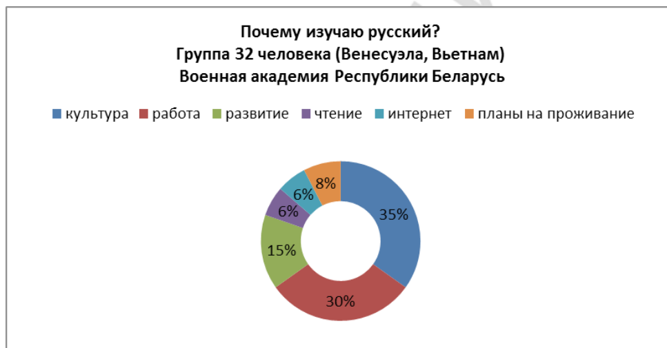
Таблица 10. Доминанты мотивации опроса «Почему я изучаю русский?» Военная академия Республики Беларусь. 32 курсанта.

Курсанты Военной академии в целом высоко определили уровень своих знаний по русскому языку. Сводная таблица представлена ниже.