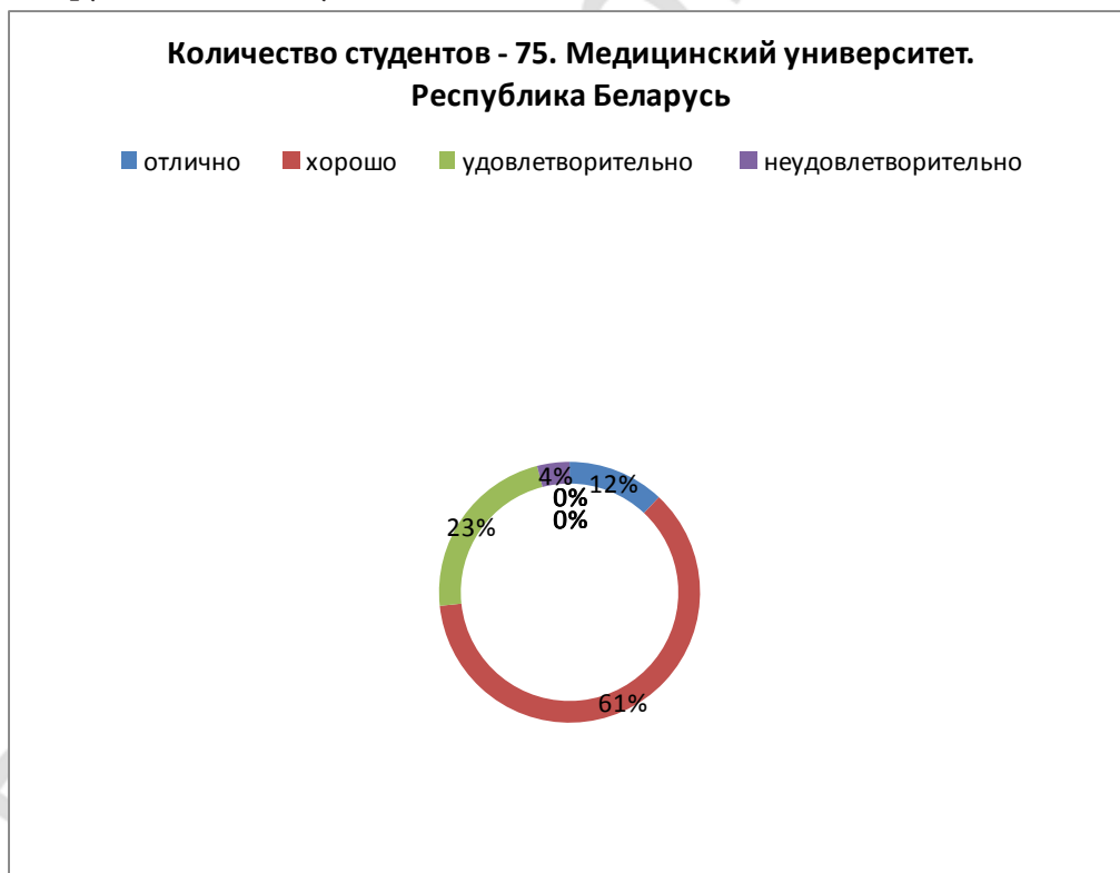
Таблица 8. Уровень владения русским языком. Самоанализ студентов Государственного медицинского университета. Республика Беларусь. Всего 75 студентов.

Только три студента признали свой уровень владения языком как неудовлетворительный, в предыдущей группе их было 14. И почти половина признала свой уровень хорошим (46 человек) для профессиональной подготовки. Результаты обобщены в таблице 7.