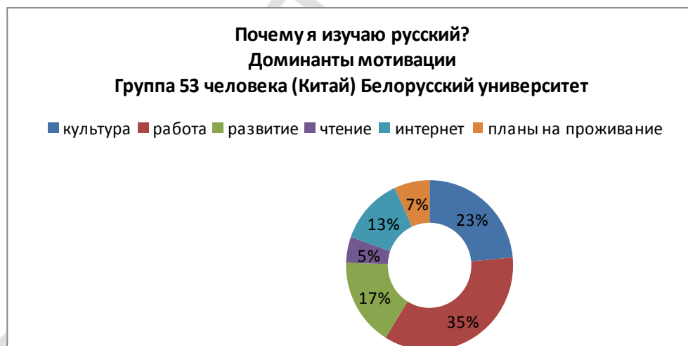
Таблица 2. Доминанты мотивации опроса «Почему я изучаю русский?». Азиатский регион. 53 студента. Белорусский государственный университет.

Для исследования было важно выяснить, как студенты сами оценивают свои знания. Результаты второй части опроса – самостоятельного