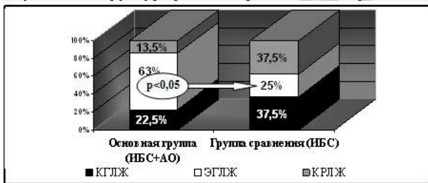
Рисунок 2 – Структура ремоделирования миокарда левого желудочка

При проведении доплерэхокардиографии в импульсном режиме с измерением пиковых скоростей трансмитрального кровотока выполнен анализ диастолической функции ЛЖ. По сравнению с показателями пациенток группы сравнения в основной группе установлено уменьшение скорости потока периода раннего наполнения (пик Е), увеличение скорости потока позднего наполнения (пик А) и уменьшение отношения Е/А трансмитрального кровотока, свидетельствующее о диастолической дисфункции миокарда ЛЖ у женщин с окружностью талии≥80 см (таблица 4).