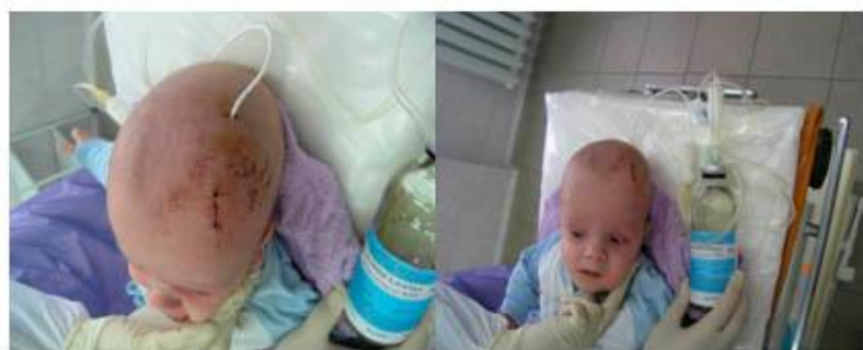
Рисунок 1.2. Больной 7 мес. Наружное вентрикулярное дренирование НАРУЖНОЕ ВЕНТРИКУЛЯРНОЕ ДРЕНИРОВАНИЕ

После интубации ребенок укладывается на операционный стол на спину, его голова располагается по средней линии. На кожу головы наносится рисунок разреза и место вывода дренажа. Линейный разрез кожи, подкожной клетчатки и апоневроза длиной до 2 см. Гемостаз. После создания отверстия в кости в проекции переднего рога бокового желудочка, выполняется его пункция, затем устанавливается катетер. Дистальный сегмент катетера туннелируется подкожно и выводится в 3-5 см кзади от первоначального разреза через контрапертурный разрез. Затем проводится ушивание первоначального разреза, дистальный сегмент катетера фиксируется к коже и подсоединяется к закрытой стерильной системе, накладывается асептическая повязка. В дальнейшем внутричерепное давление регулируется уровнем расположения резервуара дренажа. Курс антибактериальной терапии продолжается весь период функционирования дренажа. На протяжении всего послеоперационного периода осуществляется мониторинг давления ликвора, его белкового и клеточного состава, проводится нейроофтальмологический контроль, по показаниям выполняются повторные КТ или МРТ исследования.