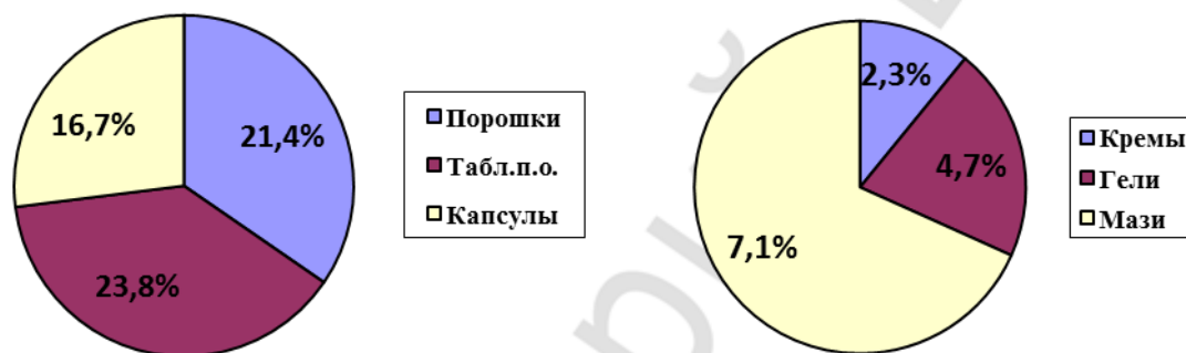
Рис. 3 – Диаграмма распределения ХП по агрегатному состоянию

В результате анализа установлено, что изучаемые ЛС по агрегатному состоянию представляют собой твердые, жидкие и мягкие лекарственные формы. Их доли находятся в соотношении 61,9%: 24,0%: 14,1% (рисунок 3).