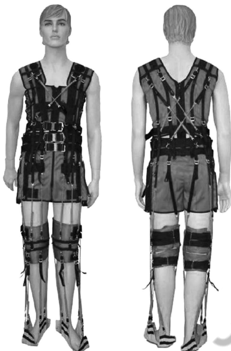
Рис. 3. Лечебный костюм «РЕГЕНТ»*

* https://ortomedtehnika.ru/product/lechebnyy_kostyum_adeli