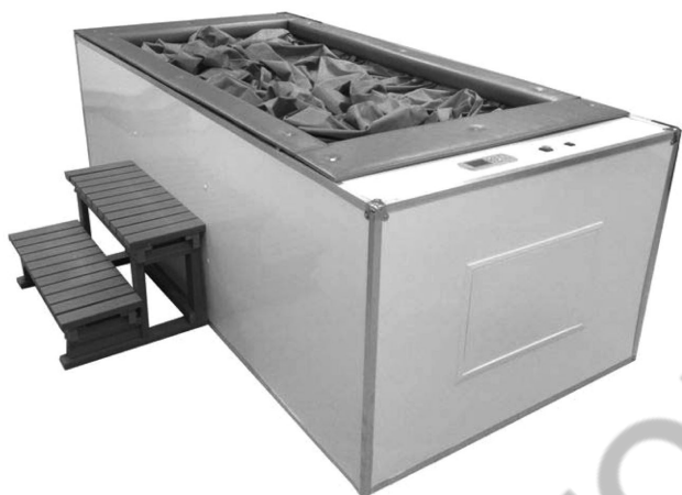
Рис. 7. Аппарат «сухой» иммерсии*

* Центр авиакосмической медицины. «Сухая» иммерсия – невесомость по рецепту [электронный ресурс]. – Режим доступа: http://amc-si.com/sukhaya-immersiya . – Дата доступа: 2007.