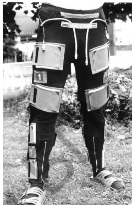
Рис. 4. Электромиостимулятор «МИОСТИМ»*

* http://amc-si.com/tovari-i-uslugi/lechebnyy-kostium-regent