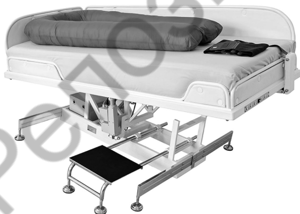
Рис. 8. Стол инверсионный для лечебного воздействия на пациента*

* Центр авиакосмической медицины. «Сухая» иммерсия – невесомость по рецепту [электронный ресурс]. – Режим доступа: http://amc-si.com/sukhaya-immersiya . – Дата доступа: 2007.