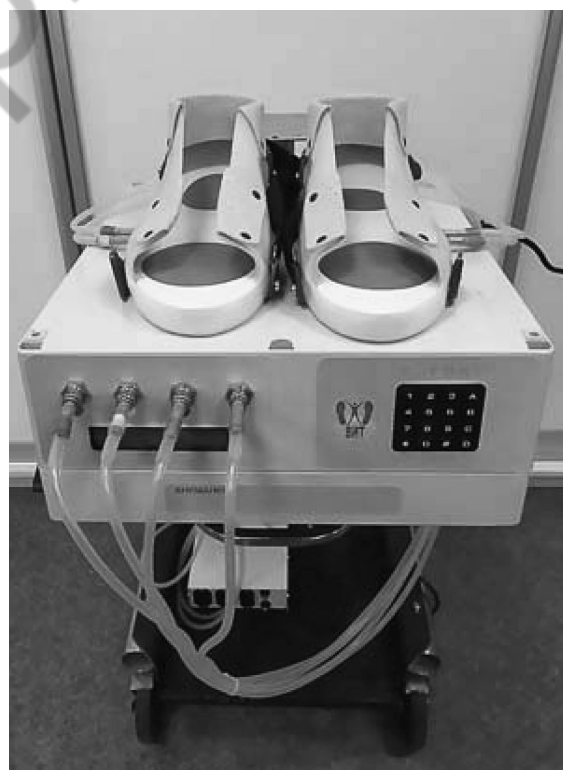
Рис. 1. Устройство «КОРВИТ»*

У взрослых пациентов приоритетным направлением для использования данной мето-