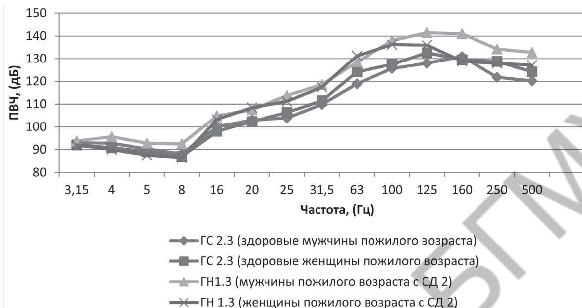
Рис. 3. Значения ПВЧ в ГН 1.3 и ГС 2.3

31,5; 63; 100; 125; 160 и 500 Гц. Значения ПВЧ мужчин и женщин пожилого возраста в ГН 1.3 и ГС 2.3 представлены на рисунке 3.