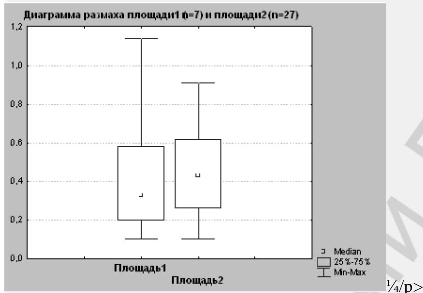
Рис. 1. Изображение акцелерографической кривой

Величина, равная площади под графиком между указанными двумя произвольными точками кривой и нулевой линией, нами определена как акцелерографическая скорость восстановления, а величина угла наклона кривой как акцелерографический индекс восстановления.