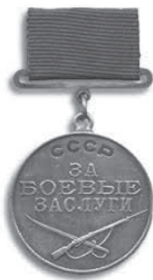
Рис. 2. Медаль «За боевые заслуги»