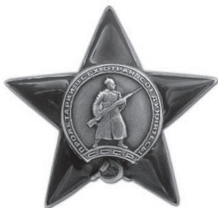
Рис. 4. Орден «Красная Звезда»