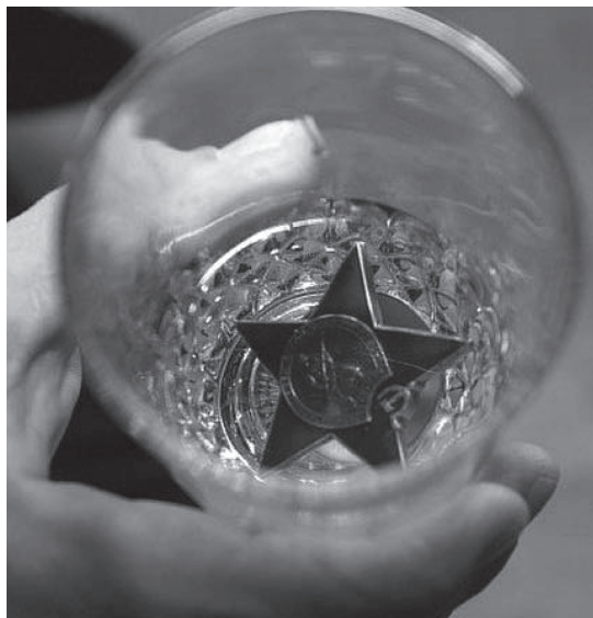
Фото 1. стакан, а в нем «обмываемая награда»

На все указанные выше ордена и «Геройство» командир дивизии должен был давать либо свое согласие, либо изменить орден или степень ордена и отправить выше по команде. В армии и на фронте рассматривались все представления и делались заключения двумя лицами – командующим и Членом Военного совета. Они или давали свое согласие или понижали, а иной раз даже могли и повышать статус награды.