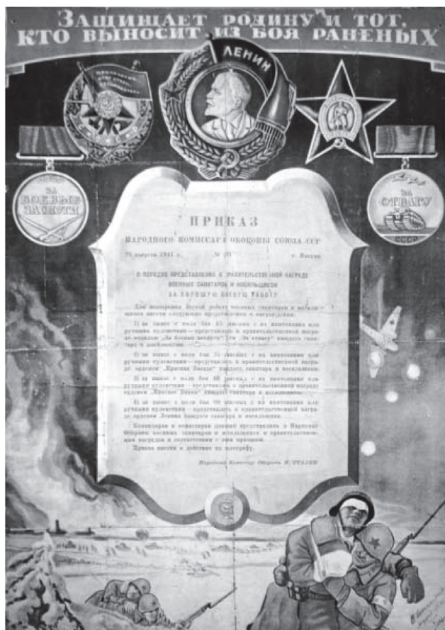
Рис. 1. Приказ НКО СССР от 23.08.1941 г. № 281

Данный приказ позволил представлять к награде особо отличившихся представителей медицинской службы войсковых формирований во время выполнения ими своей «боевой работы» – организации и проведения мероприятий по поиску, сбору, выносу, вывозу с поля боя раненых и пораженных бойцов вместе с их оружием, оказании им первой медицинской помощи и эвакуации на передовые этапы медицинской эвакуации (посты санитарного транспорта, медицинские посты рот, медпункты батальонов, дивизионов, бригад, медсанбаты и госпитали).