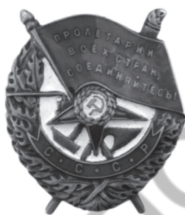
Рис. 5. Орден «Красное Знамя»