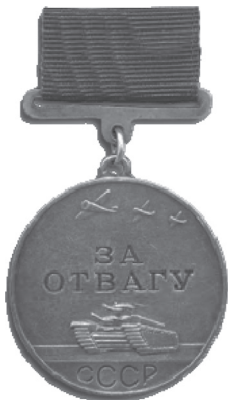
Рис. 3. Медаль «За отвагу»