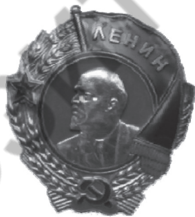
Рис. 6. Орден «Ленина»

В приказе предписывалось «...Для поощрения боевой работы военных санитаров и носильщиков ввести следующие представления о награждении: