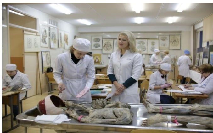
Рис.4. Экзамен по анатомии человека