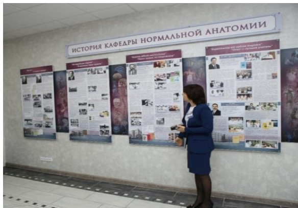
Рис. 12. Открытие музея кафедры нормальной анатомии

сотрудники кафедры нормальной анатомии и других морфологических кафедр активно участвовали в открытии нового здания краеведческого музея и экспозиции, посвященной академику Д.М.Голубу (рис. 13).