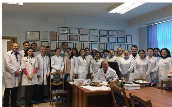
Рис. 11. Мероприятия по воспитательной работе