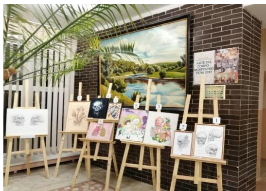
Рис. 10. Конкурс «Анатомический рисунок» (2020)