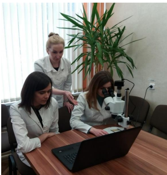
Рис. 2. Аспиранты кафедры нормальной анатомии