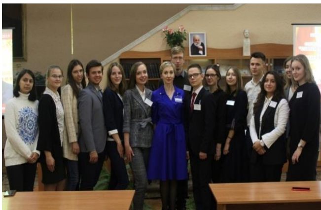
Рис. 8. Актив студенческого научного кружка кафедры

который постоянно на конкурсе научных кружков занимает призовые места (рис. 8). Ежегодно на научной студенческой конференции, проводимой университетом, заслушиваются от 20 до 30 научных докладов студентов. Студенты-кружковцы постоянно становятся победителями Республиканского конкурса научных работ, выполняемых под руководством опытных преподавателей кафедры. Так, в 2020 году в рамках школы молодых ученых в НИР участвовало 34 студента. Они выступили с 42-мя докладами на научно-практических конференциях (38 докладов – на международных, 4 доклада – на республиканских), под руководством преподавателей было опубликовано 62 статьи и тезиса; на Республиканский