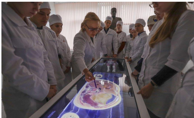
Рис.5. Инновационные технологии обучения

видеолекции и видеоуроки с демонстрацией на органах, органоконструкциях и телах умерших людей; электронные учебно-методические комплексы. Преподавание анатомии человека проводится на основе мотивированного обучения с