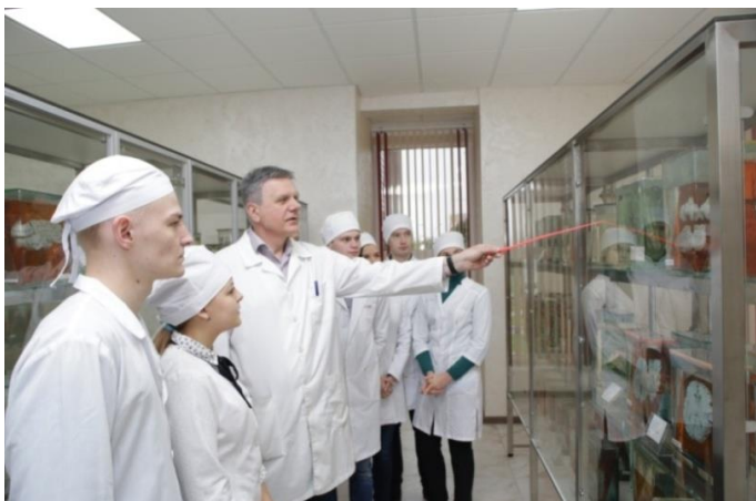
Рис. 7. Обучение студентов в обновленном музее кафедры

заменена вытяжных шкафов и, лабораторной мебели.