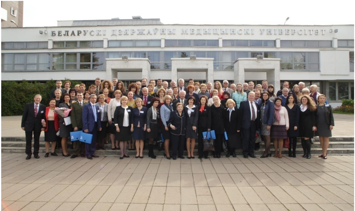
Рис. 3. Участники международной научно-практической конференции, посвященная 115-летию со дня рождения академика Д.М. Голуба (2016)

За последние 5 лет преподавателями кафедры опубликованы: 3 учебные пособия, 2 монографии, более 280 публикаций, из них 66 статей и тезисов в журналах (в том числе 30 работ в журналах РБ, 36 – за рубежом), 207 статей и тезисов - в сборниках материалов международных, республиканских и университетских конференций (из них 19 на английском языке). Сделано 82 акта внедрения в образовательный процесс различных кафедр медицинских университетов Беларуси и России и в лечебно-диагностический процесс организаций практического здравоохранения. Получен 1 патент на изобретение РБ, 1 положительное уведомление на выдачу патента на изобретение, 2 свидетельства на рационализаторское предложение.