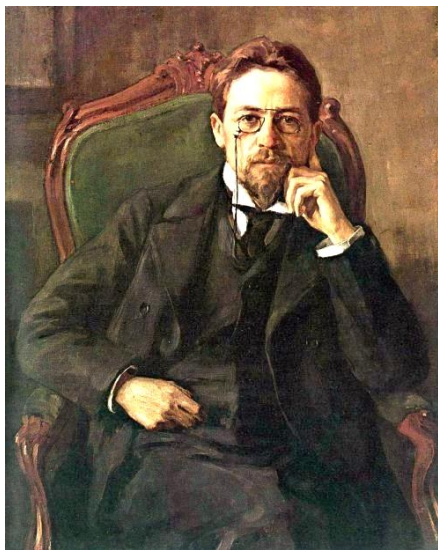
И. Э. Браз «Портрет А. П. Чехова». 1898

Антон Пáвлович Чéхов родился 17 (29) января 1860 г. в Таганроге, в семье мелкого торговца. В семье было четверо братьев и сестра.