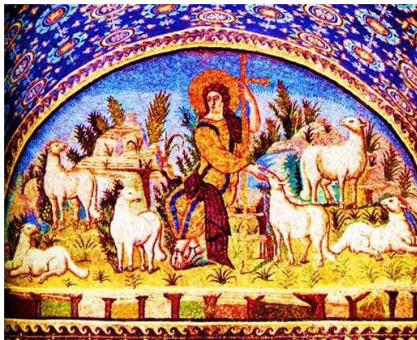
Фрагмент мозаики мавзолея Галлы Плацидии в Равенне. V век

Всего́ лишь чѣтверть дóллара. Вы приѣхали сюда́ изда́лека, запла́тили за самолѣ́т, за поѣзд, за гостини́цу, за пи́щцу, за прохладите́льные на́питки, за ко́фе. Вам что, жа́лко ещѣ нѣско́льких це́нтов? Но мно́гим жа́лко. Они́ недово́льны: их не предупрежда́ли. Они́ хотят ви́деть ра́й да́ром. Гру́ппа тури́стов жде́т, пока́ кто-нибу́дь оди́н, ще́дрый и нетерпели́вый, опу́стит моне́тку в про́резь аппара́та — и тогда́ вспыхну́т проже́кторы, и на коро́ткий миг рай ста́нет зеленѣе, а Госпо́дь — добре́е. Толпа́ шуми́т гро́мче — но свет га́снет, и все́ вокру́г о́пять по́крыто́ су́мраком.