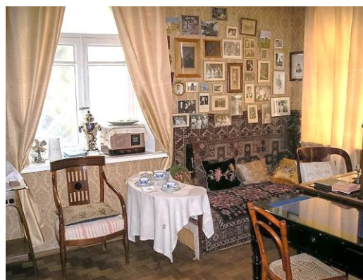
Кабинет А. П. Чехова

Похороны состоялись в Москве. Студенты Московского университета, взявшись за руки, образовали на протяжении многих кварталов цепь, охранявшую траурную процессию.