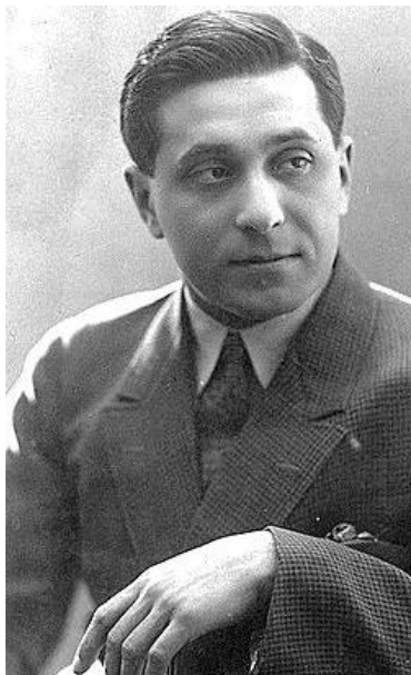
М. М. Зощенко. 1920

Зощенко Михаил Михайлович вошёл в русскую литературу как писатель-сатирик, переводчик, драматург.