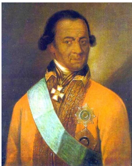
Неизвестный художник «Портрет А. П. Ганнибала»

Если мы посмотрим на портрет великого русского поэта Пушкина, то обратим внимание на необычную для славян внешность Александра Сергеевича. Загадку происхождения поэта можно разгадать, ознакомившись с историей его семьи.