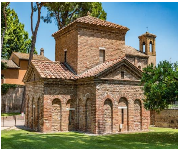
Мавзолей Галлы Платидии в Равенне. V век

На открытке — рай. Господь сидит посреди ослепительно зелёного, вечно весённого рая, вокруг него пасутся белые овечки.