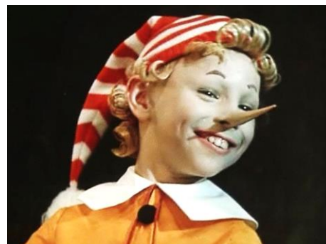
Кадр из фильма «Приключения Буратино». 1975

Необходимо отметить огромный вклад Толстого в отечественную детскую литературу. Именно Алексеем Николаевичем была написана замечательная сказка «Золотой ключик, или Приключения Буратино». В дальнейшем текст этой замечательной сказки был использован им для создания киносценария и одноимённой пьесы для детского кукольного театра. История этой сказки очень интересна, она началась незадолго до возвращения А. Н. Толстого из эмиграции, тогда в берлинском журнале был опубликован перевод повести итальянского писателя К. Коллоди «Приключения Пиноккио». С этого времени начинается долгая работа Толстого над повестью-сказкой для детей, получившей название «Золотой ключик, или Приключения Буратино». Сказка, на которой выросло несколько поколений советских детей, издавалась до 1986 года 182 раза и была переведена на 47 языков. Общий тираж составил более 14 миллионов экземпляров.