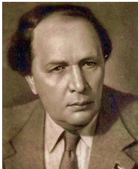
А. Н. Толстой. 1940

Алексей Николаевич Толстой — русский писатель и общественный деятель, автор социально-психологических, исторических и научно-фантастических романов, повестей и рассказов, публицистических произведений.