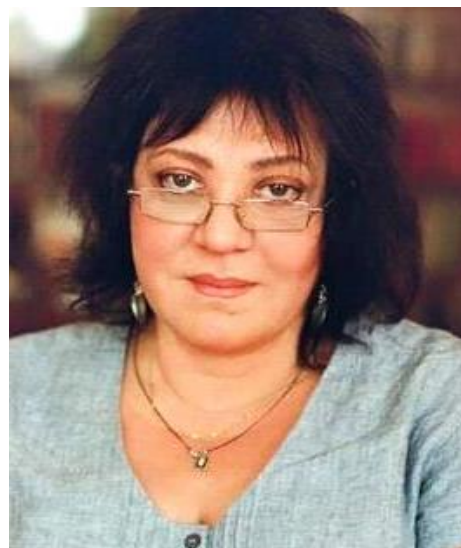
Т. Н. Толстая. 1987

Как пóзже вспомина́ла Татьяна Никитична, взя́ться за перó само́й, а не то́лько читáть и рецензи́ровать чужие произведéния, её застáвило банáльное обстоя́тельство. Пóсле перенесéнной офтальмологической оперáции Татья́не пришлóсь мéсяц