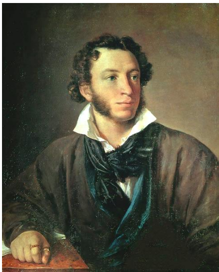
В. А. Тропинин. «Портрет А. С. Пушкина». 1827

Воспитанием Александра Пушкина, как обычно во всех дворянских семьях, занимались гувернёры-французы. В доме все разговаривали по-французски. Маленький Саша выучил французский язык и уже в 9 лет сочинял стихи на этом языке. Русскому языку он учился у бабушки и крепостной няни Арины Родионовны. Любимая няня рассказывала мальчику сказки, пела русские народные песни.