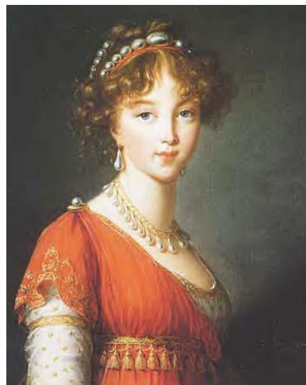
Неизвестный художник «Портрет Анны Петровны Керн»

Этот этап в его жизни «рассеял прежние мечты». Возможно, были у поэта и моменты отчаяния («без Божества, без вдохновения»). Он пишет и о ссылке («В глуши, во мраке заточенья...»). И когда он снова встречает Анну Петровну, он чувствует энергию и желание жить и работать: «Душе настало пробужденье:/ И вот опять явилась ты...». Любовь для Пушкина важна ещё и потому, что она помогает творить, создавать прекрасные произведения.