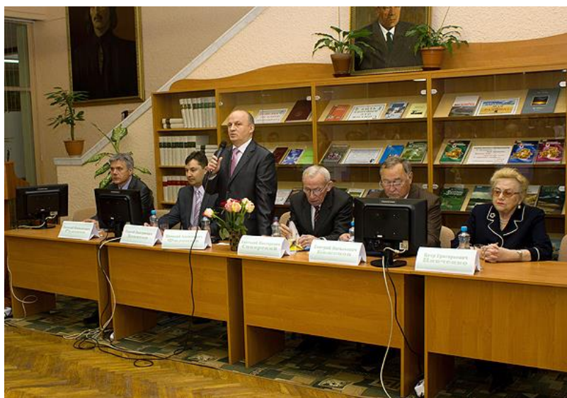
Международная научно-практическая конференция. 2011г.