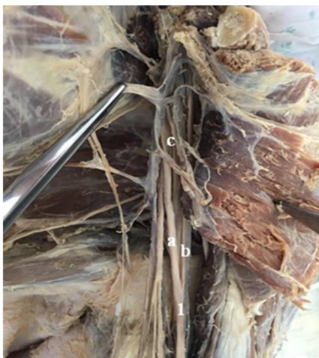
Рис. 1. Формирование срединного нерва (1) из 3-х корешков: а – медиальный корешок; б – латеральный корешок; с – задний корешок.

артерии на два артериальных ствола, медиального и латерального, которые продолжались на плече и предплечье лучевой и локтевой артериями (рис. 2).