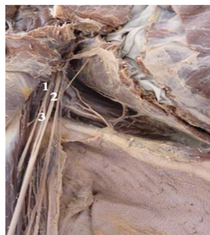
Рис. 6. Соединения между мышечно-кожным (1) и срединным (2) нервами: 3 – соединительная ветвь мышечно-кожного нерва.