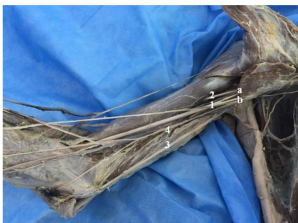
Рис. 3. Низкое формирование срединного нерва (1): а – латеральный корешок; б – медиальный корешок; 2 – мышечно-кожный нерв; 3 – локтевой нерв; 4 – медиальный кожный нерв предплечья.

В остальных 3,3% случаев установлено формирование срединного нерва из своих обычных корешков – латерального и медиального, на уровне проксимальной трети плеча, на 3 см ниже края сухожилия широчайшей мышцы спины (рис. 3).