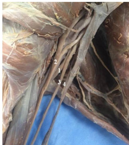
Рис. 5. Формирование мышечно-кожного нерва (1) из медиального пучка ПС: 2 – срединный нерв; 3 – локтевой нерв; 4 – медиальный кожный нерв плеча.

Мышечно-кожный нерв, в 3,3% случаев, начинался от медиального пучка плечевого сплетения (рис. 5), а в других 3,3% – соединялся со срединным нервом (рис. 6).