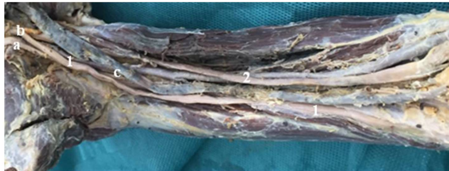
Рис. 4. Формирование локтевого нерва (1) из 2-х корешков: а – медиальный корешок; b – латеральный корешок; с – мышечная ветвь; 2 – срединный нерв.

Для локтевого нерва был выявлен вариант его формирования из двух корешков, медиального и латерального, идущих от соответствующих пучков плечевого сплетения; также, на плече от него отделялась мышечная ветвь, которая входила в плечевую мышцу для её иннервации (рис. 4).