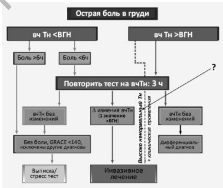
Схема 2. Быстрое исключение ОКС с определением вч тропонина (вчТн) (ЕНЖ 2011)

Рекомендации по применению антикоагулянтов прак-