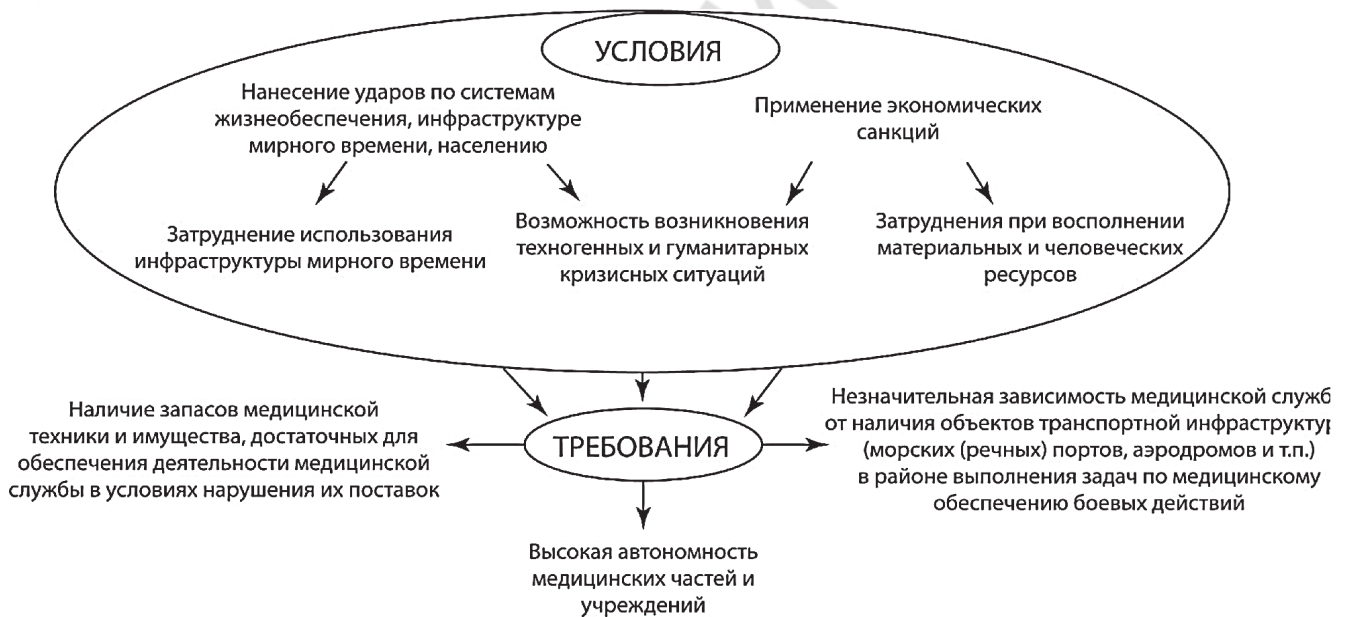
Рис. 2. Условия деятельности системы медицинского обеспечения боевых действий, возникающие в результате комплексного применения военной силы и средств невоенного характера

ки новых принципов её использования, а также повышения эффективности систем разведки и управления.