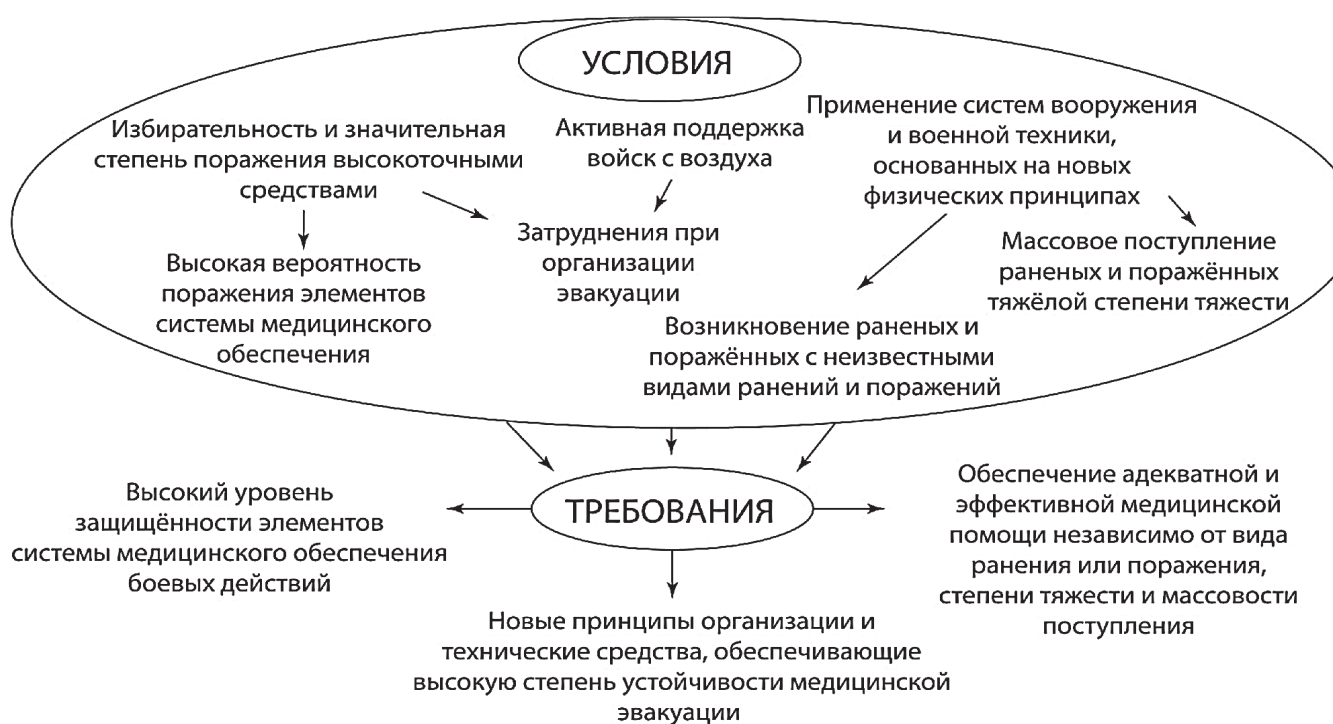
Рис. 3. Условия деятельности системы медицинского обеспечения боевых действий, возникающие в результате массированного скоординированного применения противником систем вооружения и военной техники