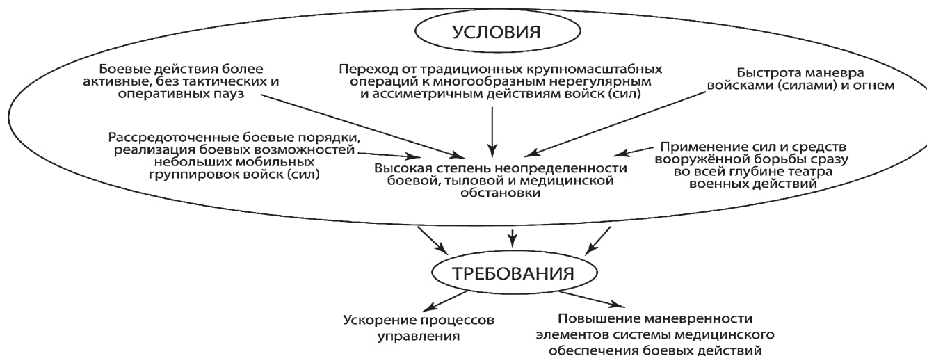
Рис. 4. Факторы, оказывающие влияние на деятельность системы медицинского обеспечения боевых действий, обусловленные скоротечностью военных конфликтов, непредсказуемостью их возникновения и течения

необходимые для захвата инициативы, информационного превосходства, контроля над боевым пространством, ударов в режиме «обнаружил – уничтожил». Улучшаются условия управления, взаимодействия ударных и обеспечивающих сил. Концепция СЦВ предполагает, что управление станет оперативнее (сократится время на принятие и реализацию решений), огневое, тактическое взаимодействие – точнее.