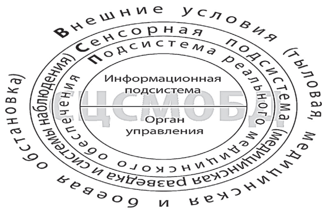
Рис. 5. Принципиальная схема сетцентрической системы медицинского обеспечения боевых действий

- степень защищённости элементов СЦСМОБД должна обеспечивать высокий уровень их выживаемости с учётом использования противником новых видов вооружения, разведки и возможности воздействовать на всю глубину оперативного построения наших войск;