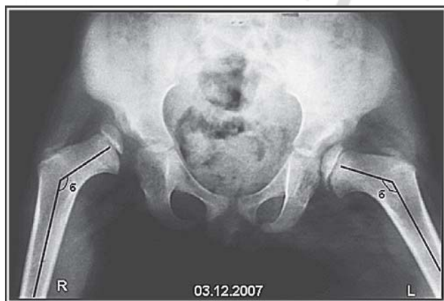
Рис – 1б. Рентгенограмма таза. Отведение и внутренняя ротация. Врожденный вывих обоих бедер. Черным указаны шеечно-диафизарные углы (углы β) до операции (правый – 140° и левый-136°). Угол патологической антеторсии справа-65°, слева-30°.

(ВВБ) на современном этапе частично связана с отсутствием четких критериев безуспешности консервативного вправления, протоколов и показаний к операции.