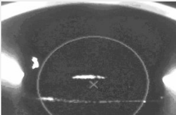
Рис. 2. Помутнение задней капсулы после имплантации гидрофобной ИОЛ Acrysof.

Оценивали денситометрическую плотность задней капсулы хрусталика путем вычисления индекса ПЗК (ИПЗК) – отношения денситометрической плотности передней поверхности ИОЛ к задней поверхности ИОЛ вместе с задней капсулой в центральной 3,0мм зоне [10,11]. Статистические исследования выполняли с использованием пакетов программного обеспечения: Statistica 5,5; Excel 2000. Различия считались достоверными при P менее 0,05. Лазерную капсулотомию выполняли на Nd:YAG лазере (Lumenis).