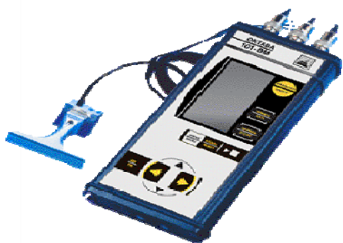
Рис. 3. Трехканальный виброметр общей и локальной вибрации ОКТАВА-101ВМ

Виброметр — анализатор спектра ОКТАВА-101ВМ — предназначен для измерения вибрации, воздействующей на человека на производстве, в транспорте, в жилых и общественных зданиях. Прибор можно также использовать для измерения вибрационных характеристик механизмов и машин.