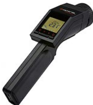
Рис. 5. Пирометр MS Pro