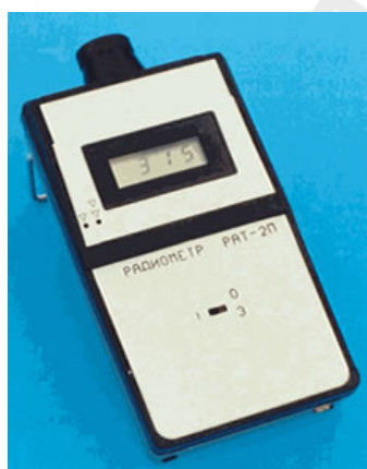
Рис. 4. Радиометр энергетической освещенности РАТ-2П

Радиометр энергетической освещенности (измеритель тепловой облученности) РАТ-2П предназначен для обеспечения измерений интегральных характеристик облучения во всем спектральном диапазоне излучения, в том числе в инфракрасной области спектра.