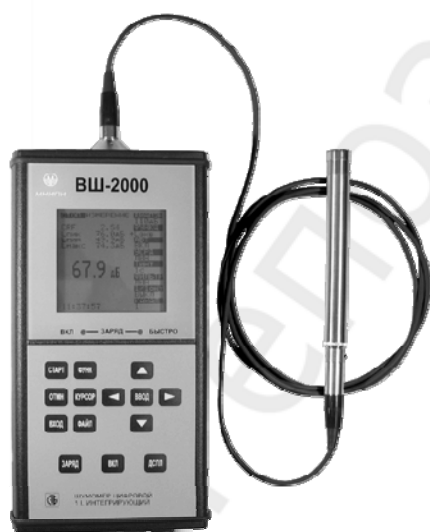
Рис. 2. Шумомер цифровой ВШ-2000