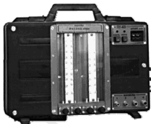
Рис. 1. Электроаспиратор ПУ-4Э

Отобранные пробы анализируют в лабораторных условиях с применением стандартных методик.