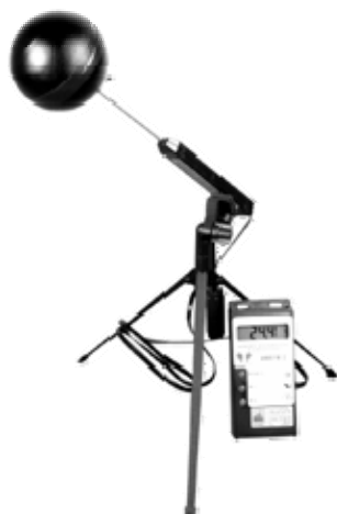
Рис. 6. Шаровой термометр

Прибор для определения индекса ТНС предназначен для интегральной оценки параметров микроклимата на рабочих местах и оценки нагревающей среды в производственных помещениях (горячих цехах) и на открытой территории, а также для обычных измерений температуры и влажности на рабочих местах. Прибор состоит из портативного электронного термогигрометра, черной тонкостенной металлической сферы и штатива. Электронный термогигрометр позволяет измерить температуру и относительную влажность воздуха, температуру «по влажному термометру», а также температуру внутри черной сферы. Таким образом, определяют все параметры, необходимые для расчета интегрального индекса тепловой нагрузки среды (ТНС).