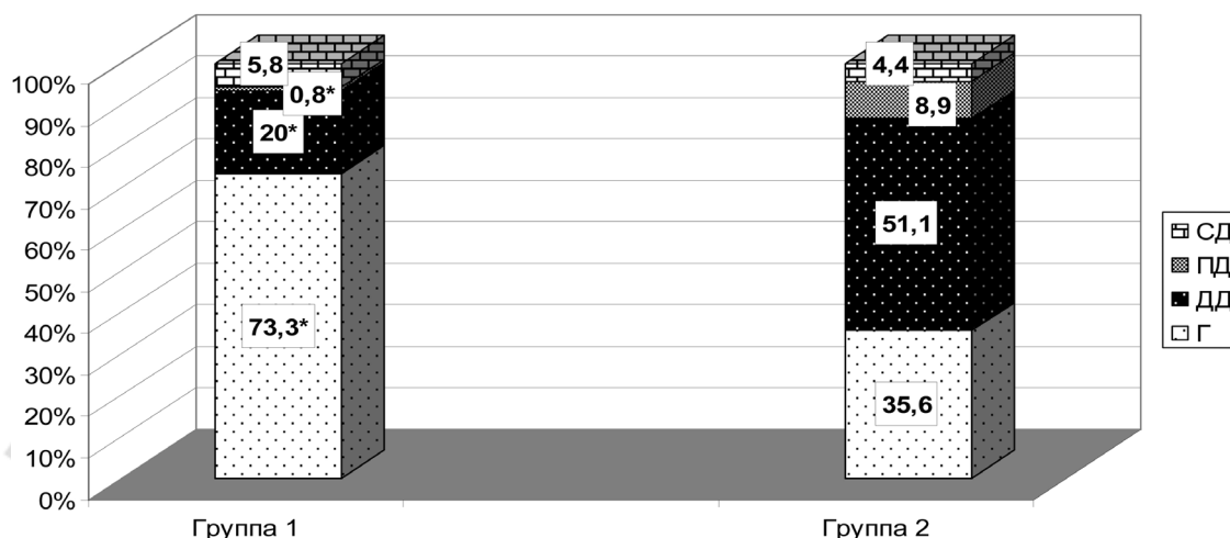
Рисунок 1. КАСПАД-типы кровообращения в группах наблюдения, %.