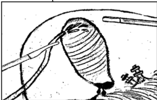
Рисунок 1 - Схема нанесения «Фибриноста» на ложе желчного пузыря

возможность его экономичного использования и равномерного распределения по кровотокающей поверхности. Объем препарата необходимого для окончательной остановки кровотечения составлял от 2 до 5 мл, в зависимости от площади и интенсивности кровотечения.